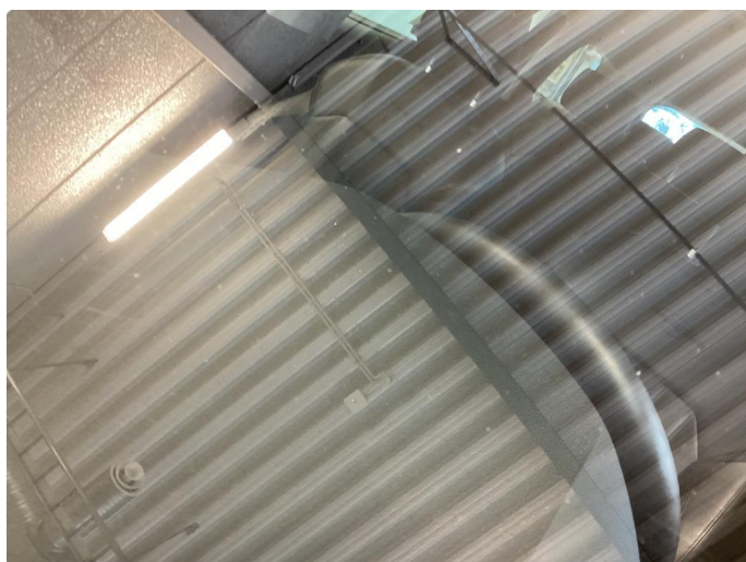
1.11 Slitt/mye steinsprut frontrute