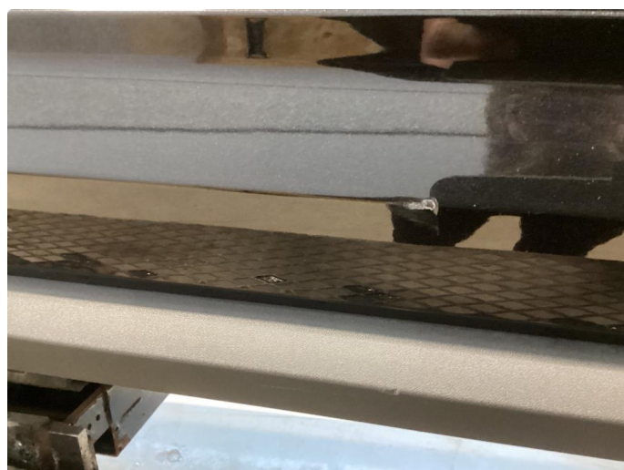
1.4 Liten p-bulk og flere kraftige knast gjennom lakk venstre baddör