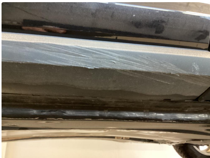
1.5 Div riper og riper nedre plastikk del venstre forrdør