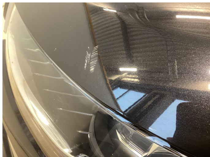
1.2 Kraftige riper panser, og flere kraftige steinsprut