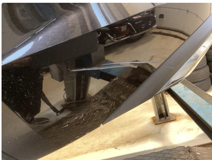
1.8 Riper støtfanger bak