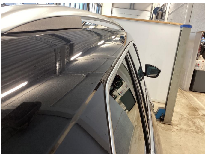
1.10 Kraftig bulk venstre takvange , mange bulker høyre takvange