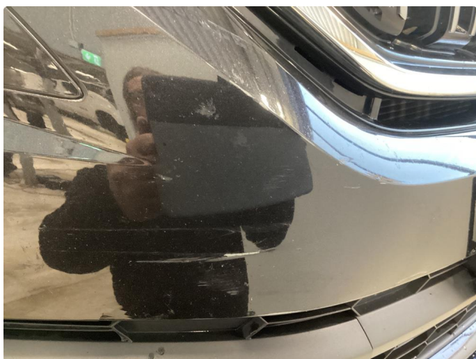
1.9 Riper/skade støtfanger foran høyre side