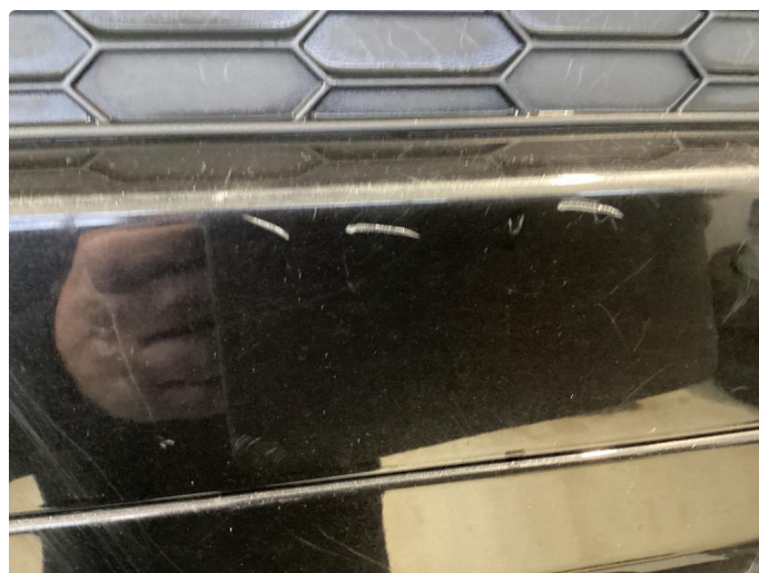
1.8 Riper støtfanger bak