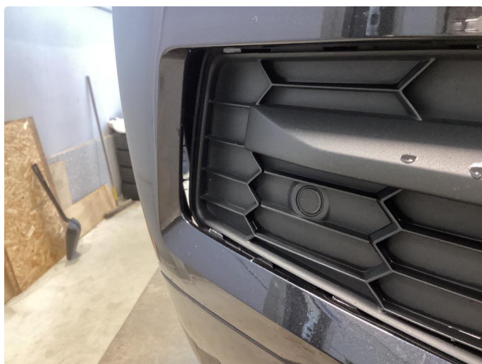
1.9 Riper/skade støtfanger foran høyre side