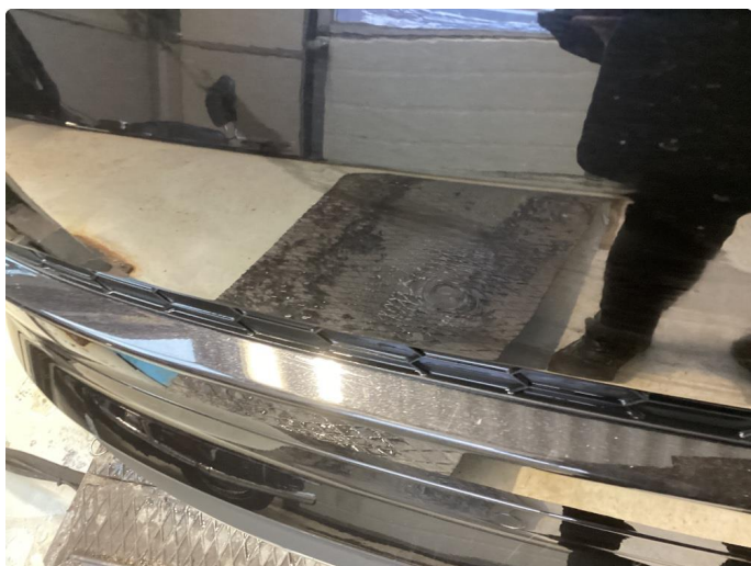
1.6 Mye riper/knast og p-bulk bakluke