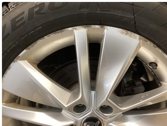
1.7 2 vinterfelger kraftig kantkjørt