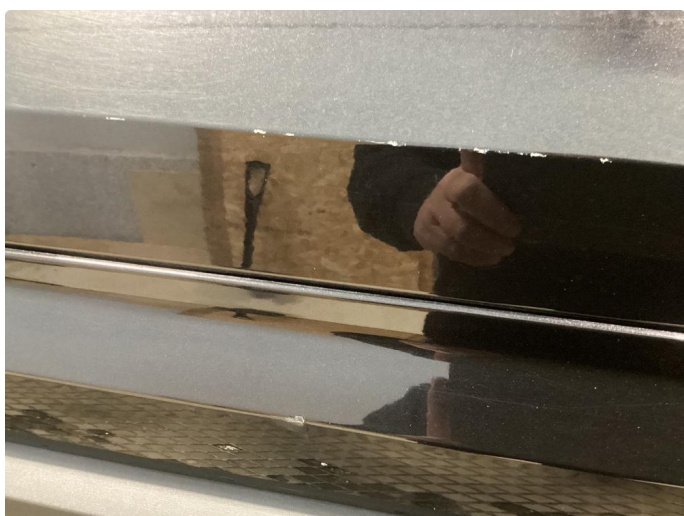
1.4 Liten p-bulk og flere kraftige knast gjennom lakk venstre baddör