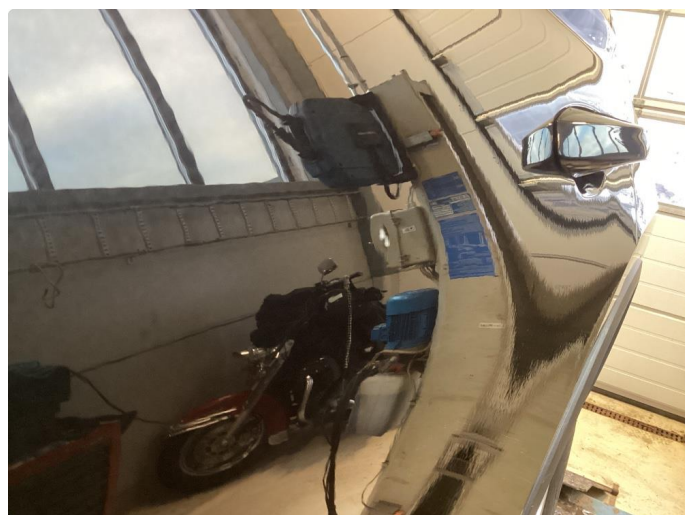
1.3 P-bulk og riper gjennom lakk venstre baddör