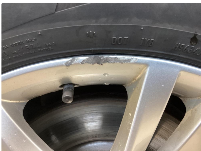
1.7 2 vinterfelger kraftig kantkjørt