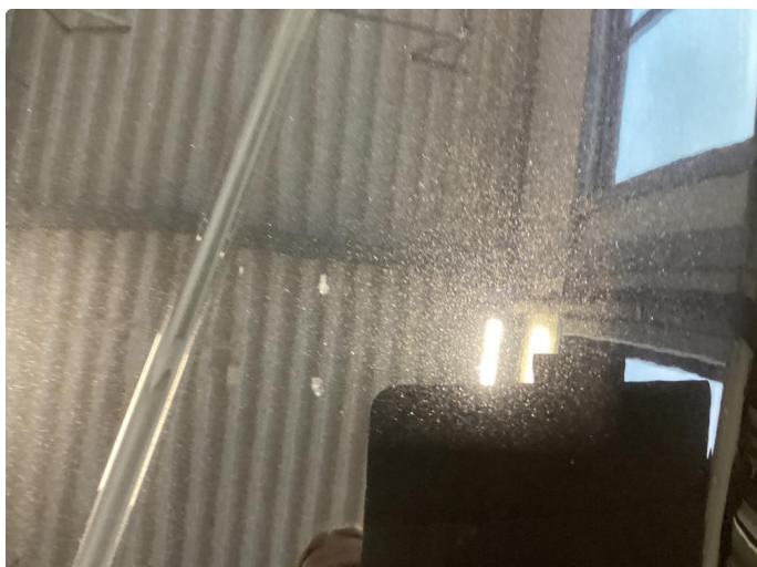
1.2 Kraftige riper panser, og flere kraftige steinsprut