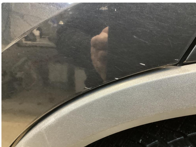
1.3 P-bulk og riper gjennom lakk venstre baddör