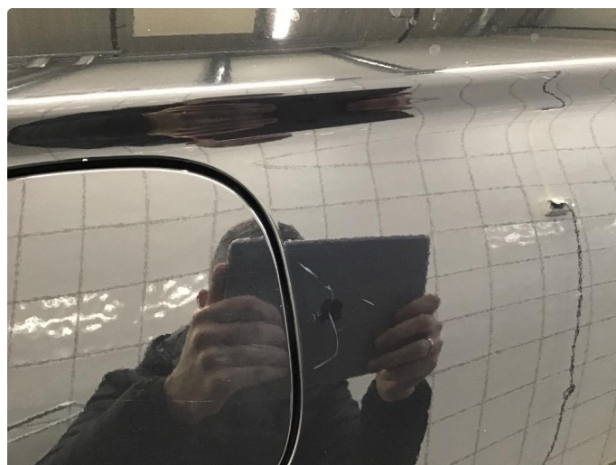
1.3 Noen små merker. Vanlig brukslitasje