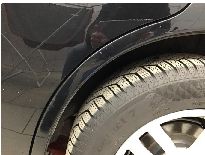
1.3 Noen små merker. Vanlig brukslitasje