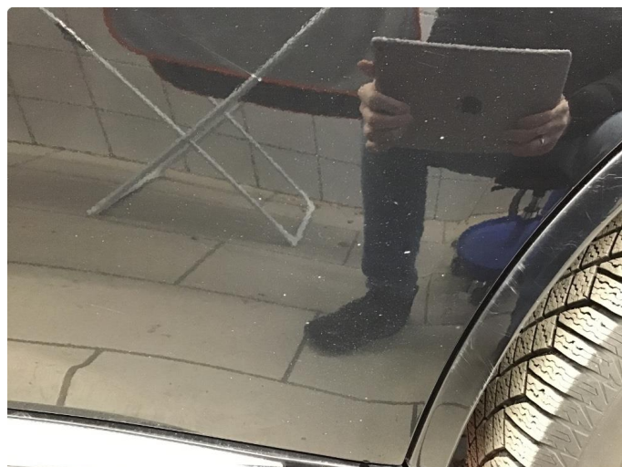
1.2 Noe steinsprut. Vanlig brukslitasje