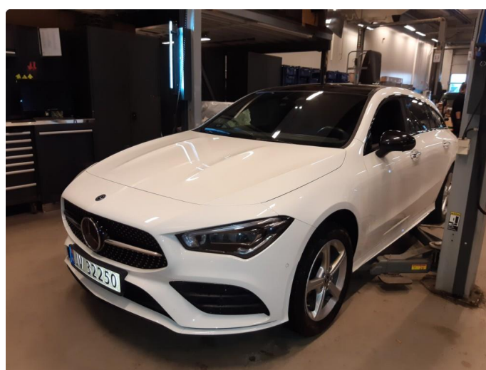
1.3 Steinsprut på frontrute og reparert.