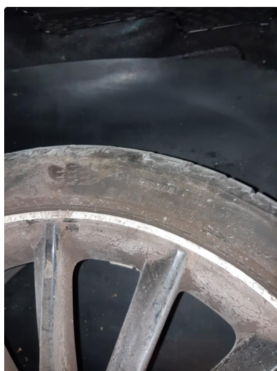
1.2 Smart reparert felgene.