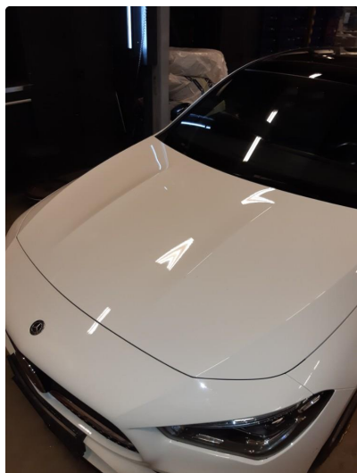
1.1 Flekket med lakkstift.