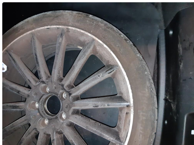
1.2 Smart reparert felgene.