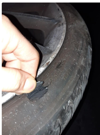
1.2 Smart reparert felgene.