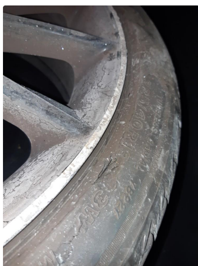
1.2 Smart reparert felgene.