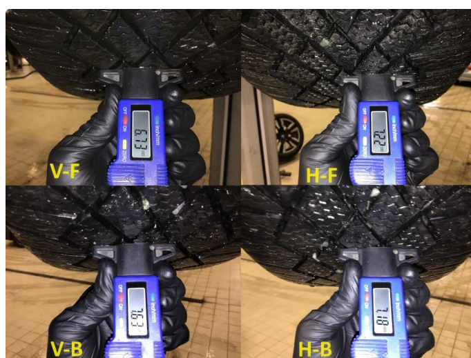
1.2 Mønsterdybde vinterdekk målt ved takst 29.11.23, 43.311km.