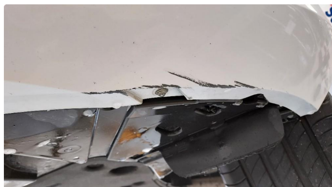
1.4 Noen skrubbskader på underkant av fanger foran. Lakkeres forenklet