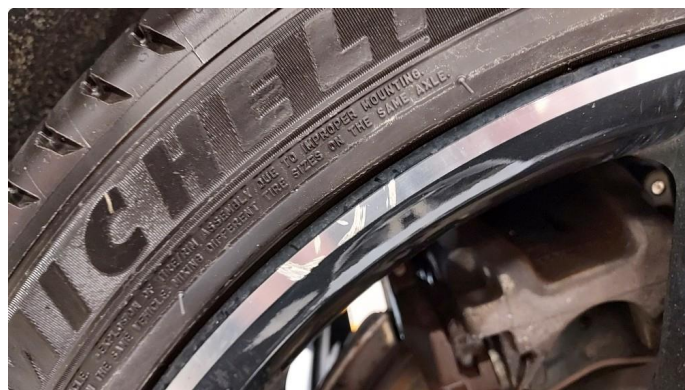
1.3 Noen små sår på en sommerfelg