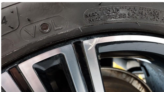
1.3 Noen små sår på en sommerfelg