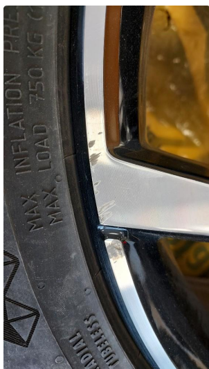
1.2 Lite ubetydelig hakk i en vinterfelg