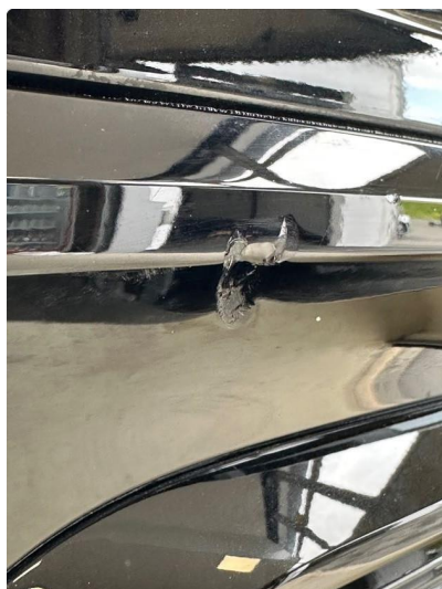
1.1 Lita ripe/hakk i fanger bak. Venstre side