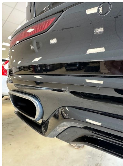
1.1 Lita ripe/hakk i fanger bak. Venstre side