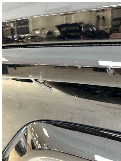
1.1 Lita ripe/hakk i fanger bak. Venstre side