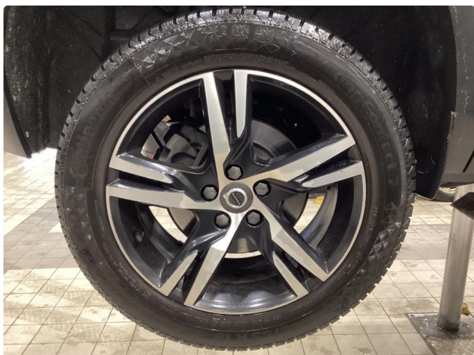
1.1 Oversiktsbilder av vinterhjul