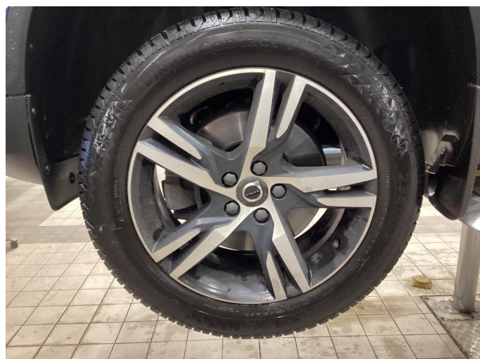
1.1 Oversiktsbilder av vinterhjul