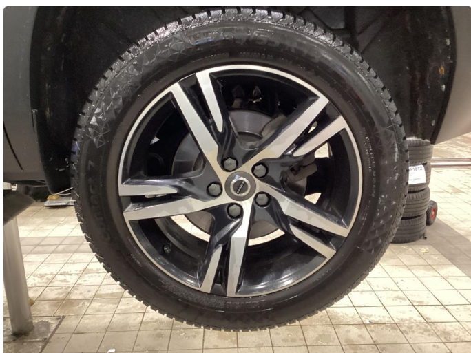
1.1 Oversiktsbilder av vinterhjul