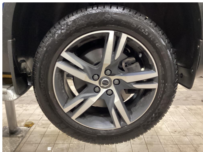
1.1 Oversiktsbilder av vinterhjul