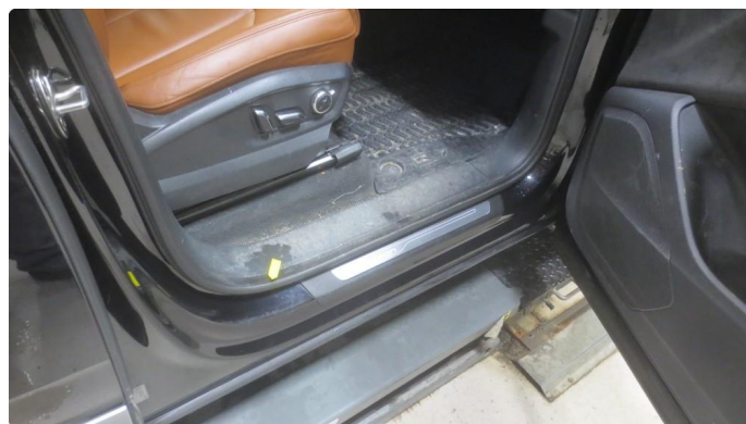
1.1 Noen riper alle innsteg. Rubbes / Poleres / Pensles.