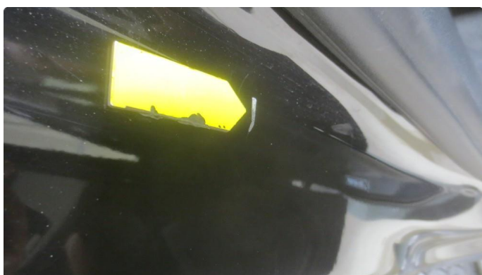
1.1 Noen riper alle innsteg. Rubbes / Poleres / Pensles.