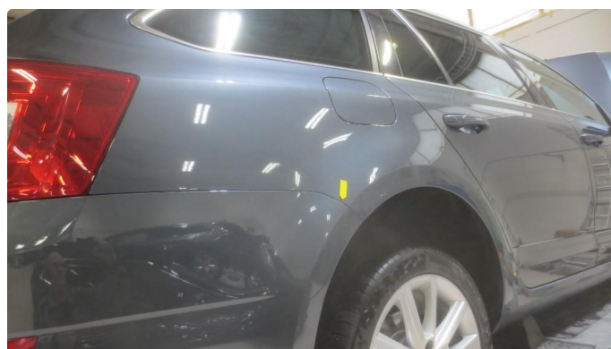
1.1 Noen lakkskader rundt om. se bilder av noen plasser.