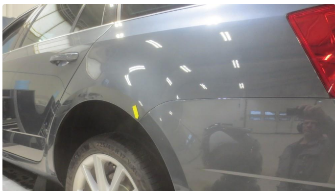
1.1 Noen lakkskader rundt om. se bilder av noen plasser.