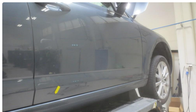
1.1 Noen lakkskader rundt om. se bilder av noen plasser.