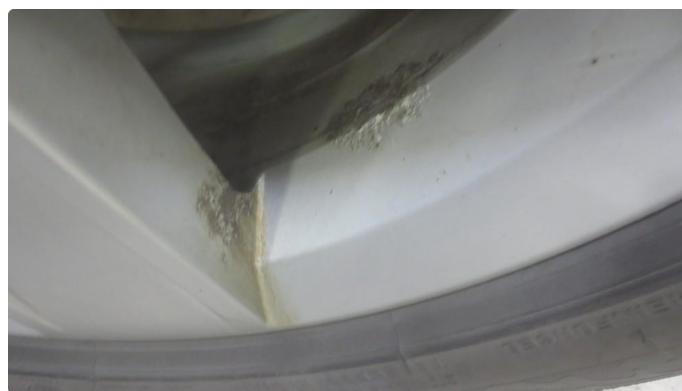
1.2 Vinterfelger har noe korrosjon av kosmetisk art.