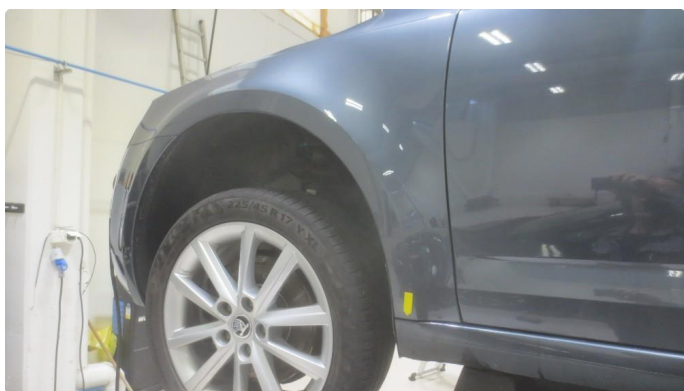
1.1 Noen lakkskader rundt om. se bilder av noen plasser.