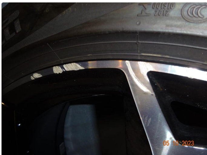
2.1 Skade på felg