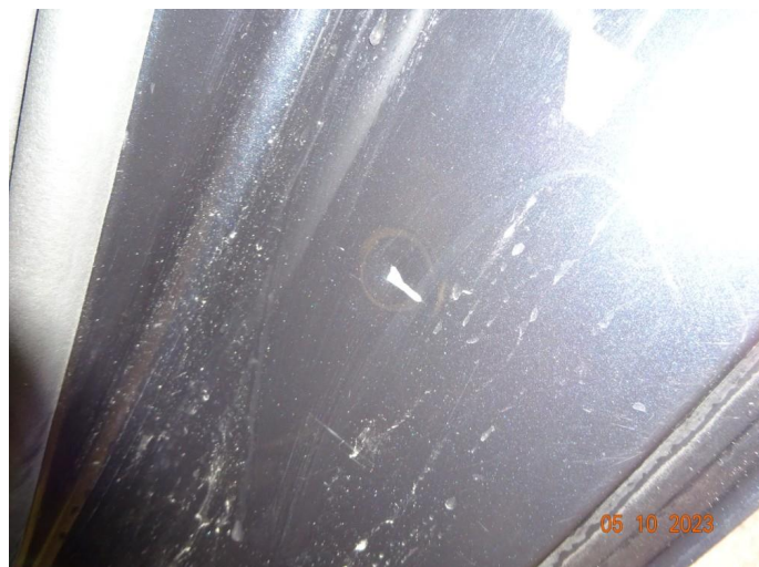
2.2 Slitt gjennom lakk