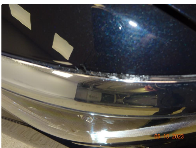
3.1 Øvrige feil