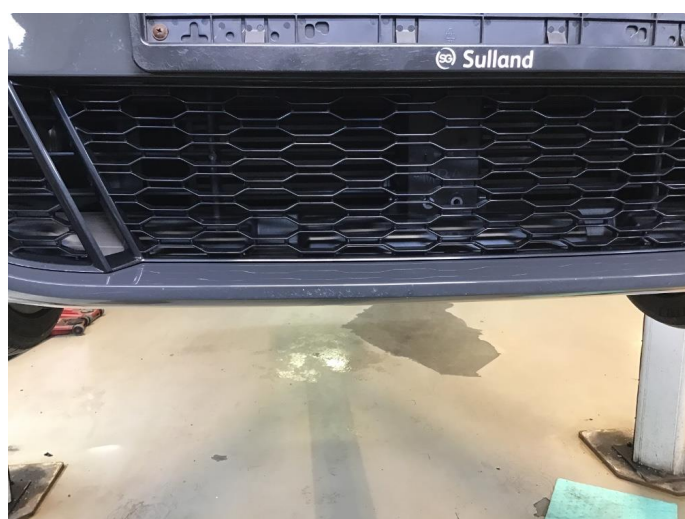
1.3 Skrubbskader underkant