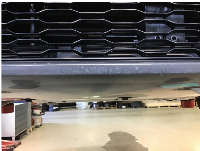
1.3 Skrubbskader underkant