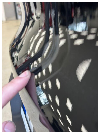
1.1 Liten bulk på bakluke