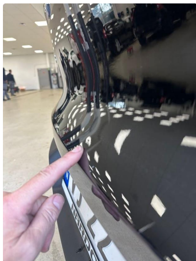
1.1 Liten bulk på bakluke