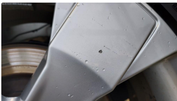
1.1 Noen små sår i to sommerfelger