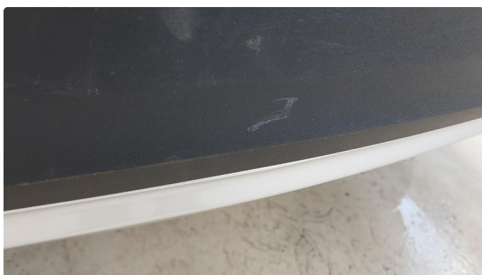
1.2 Lita ripe på fanger ved hengerfeste