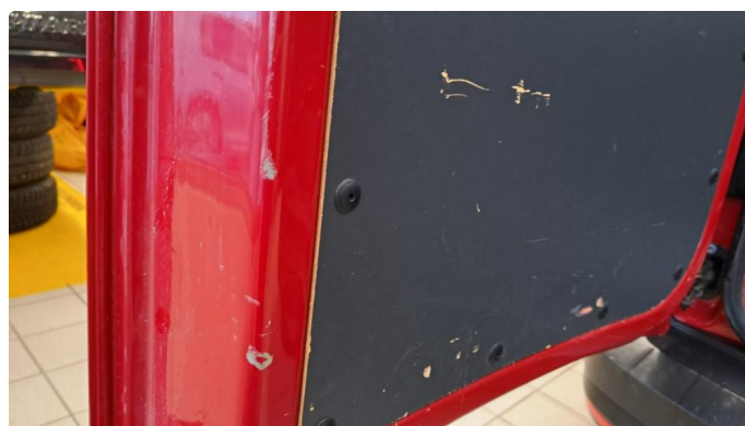
1.1 Diverse bulker og riper.