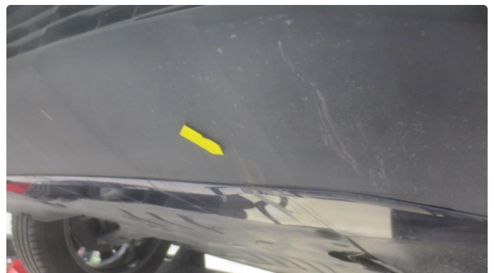
1.1 Noen riper undersiden fanger foran.