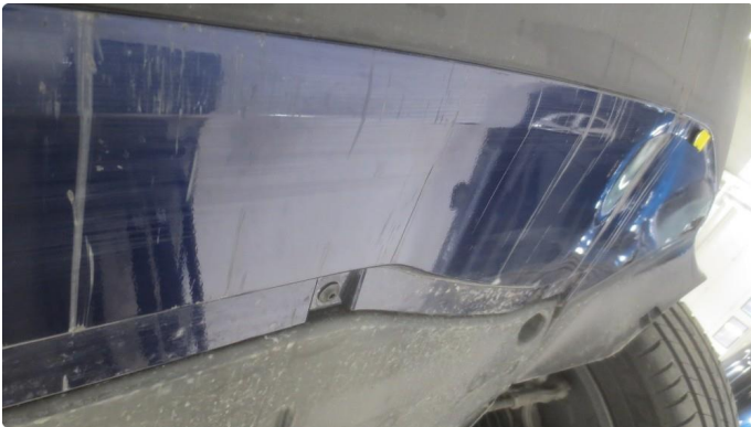
1.1 Noen riper undersiden fanger foran.