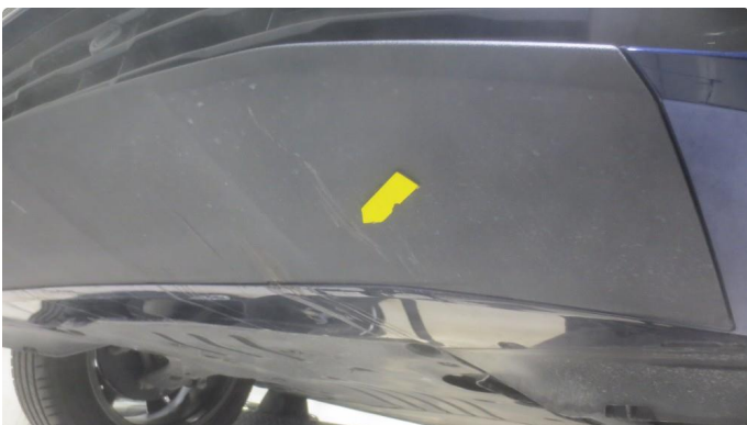
1.1 Noen riper undersiden fanger foran.