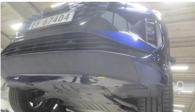
1.1 Noen riper undersiden fanger foran.