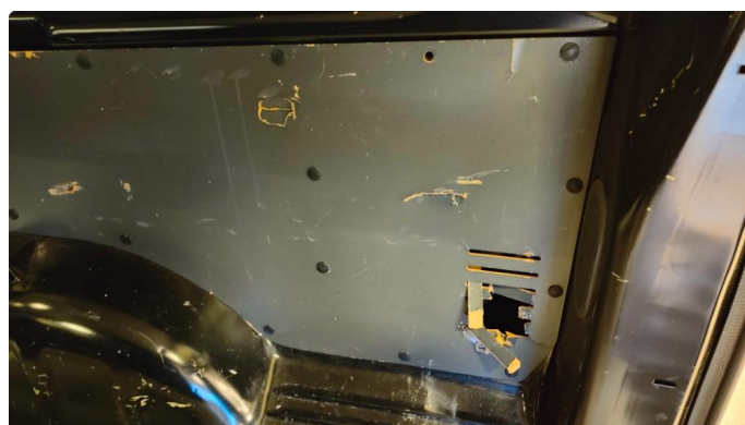
2.3 Deksler skadet/mangler