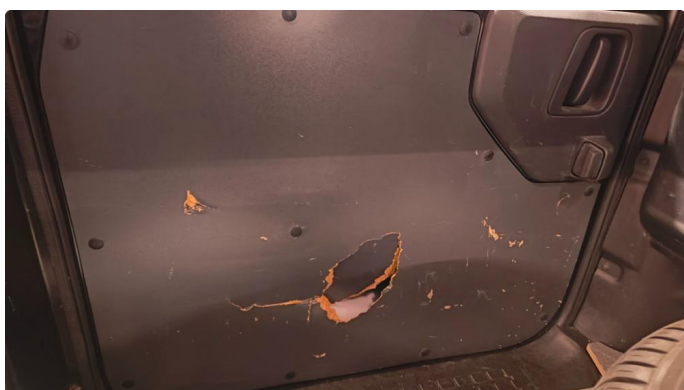
2.2 Skadet/merker etter utstyr