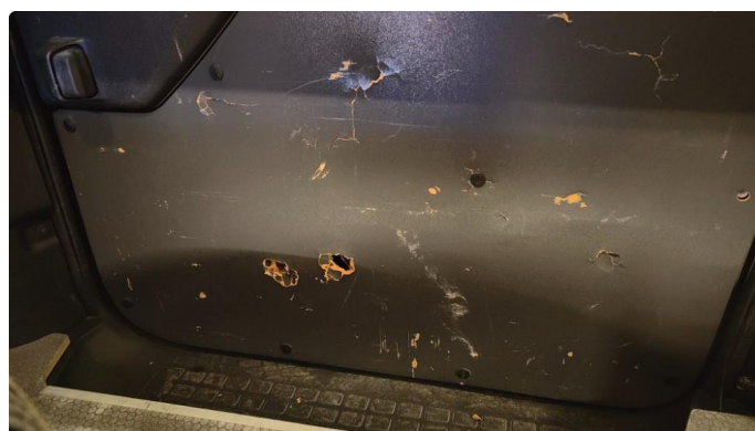
2.1 Skadet/merker etter utstyr