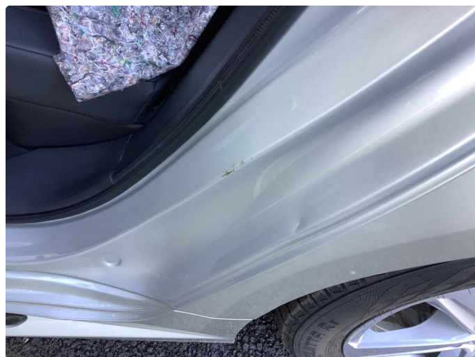
1.1 Noe små bulker