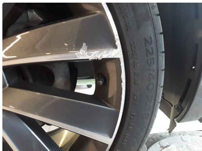
1.2 Noe kantkjørte sommerfelger.