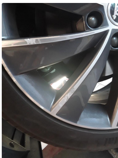
1.2 Noe kantkjørte sommerfelger.