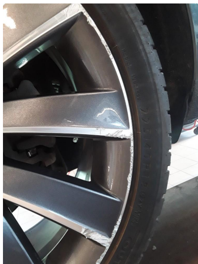
1.2 Noe kantkjørte sommerfelger.