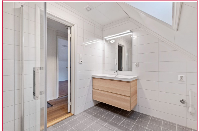
Pent flislagt bad med gulvvarme