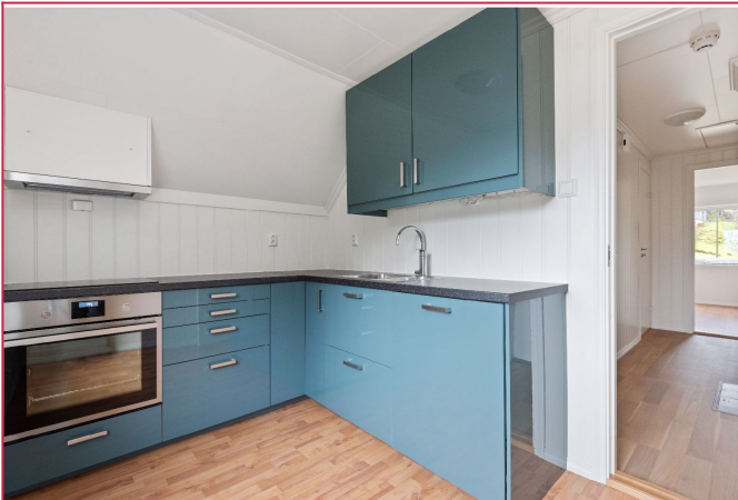
Moderne kjøkken med hvitevarer