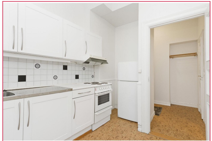
Kjøkken med frittstående hvitevarer.