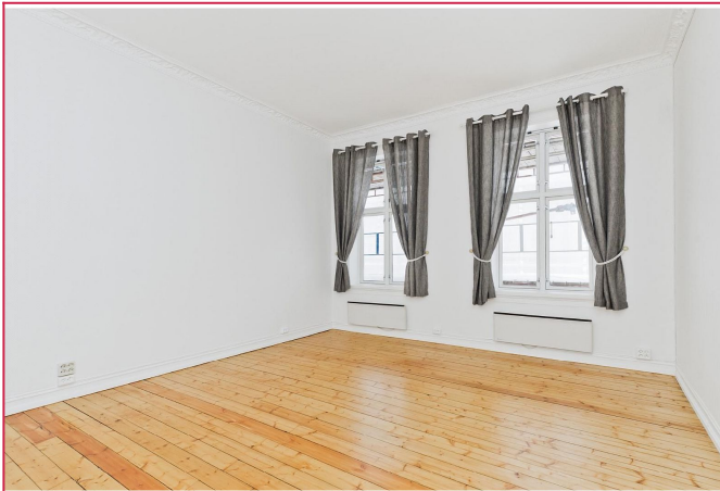
Stue med store vinduer.