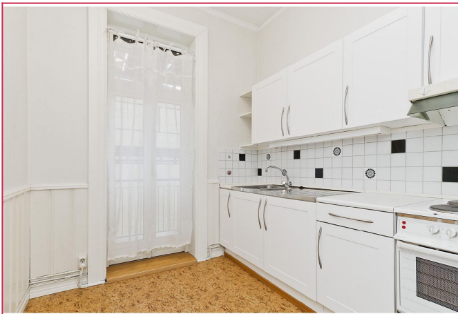
Kjøkken med utgang til balkong.