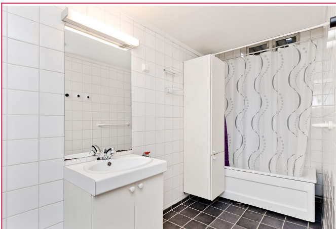
Bad med badekar og dusj.