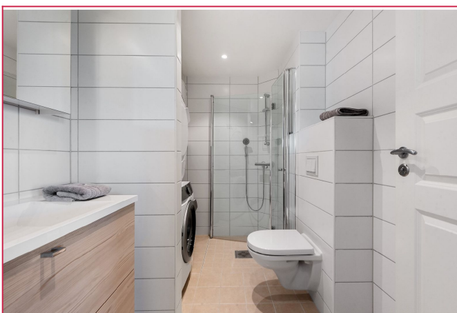
Bad nr 2 med opplegg for vaskemaskin og tørketrommel