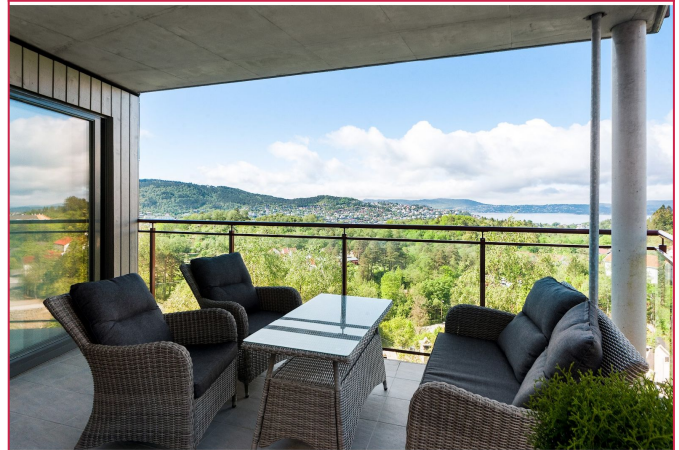
Nydelig utsikt fra balkong over Bergen golfklubb, Eidsvåg, Byfjorden og Askøy