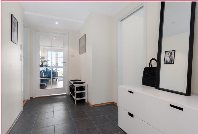
Lys og fin entré med fliser på gulvet