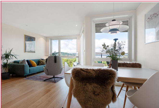
Trivelig stue med store vinduer som sikrer godt med lys og gir en god romfølelse