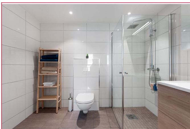
Pent helfislet bad av god størrelse med varmekabler i gulv