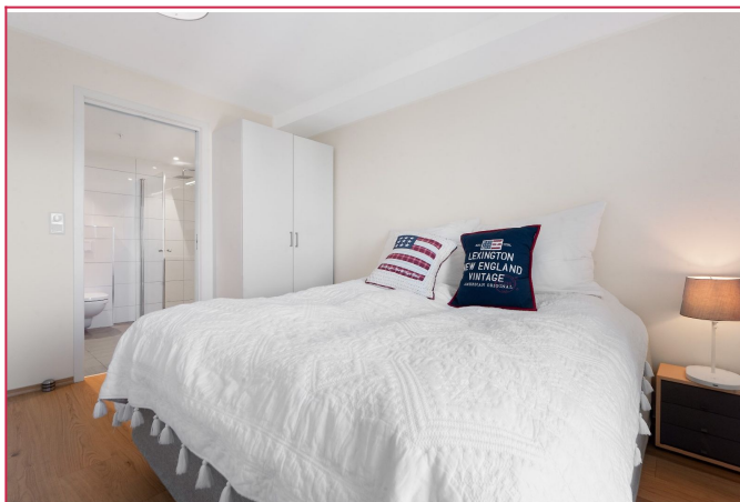
Romslig hovedsoverom med tilgang til eget bad