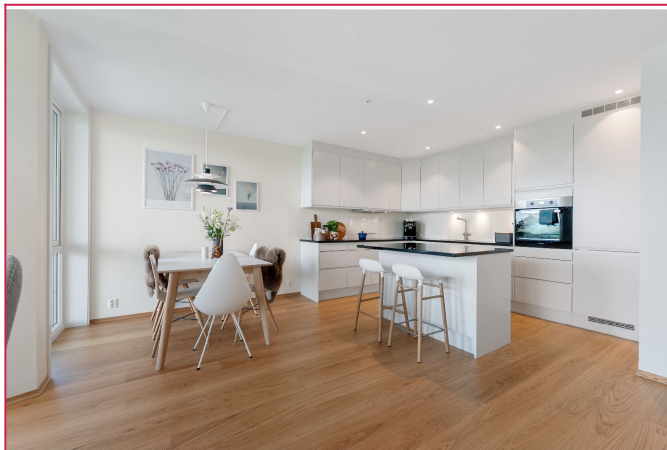
Flott kjøkkeninnredning med god skap- og benkeplass