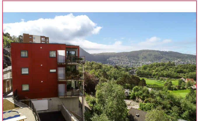
Velkommen til Storbotn 89A - Stilfull og attraktiv hjørneleilighet i et nyere leilighetskompleks