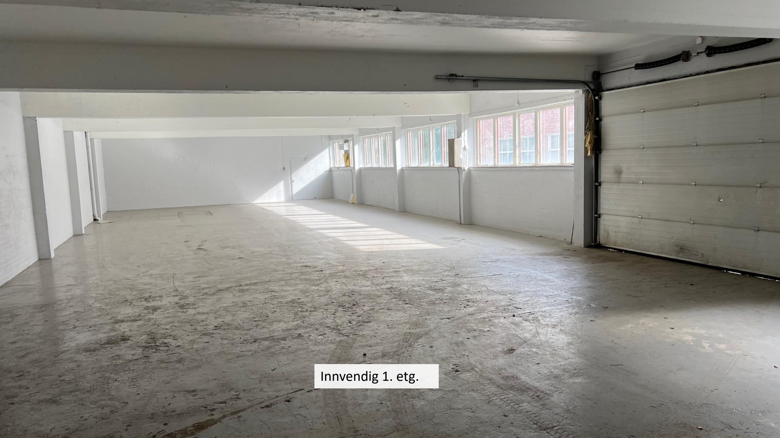
Innvendig 1. etg.