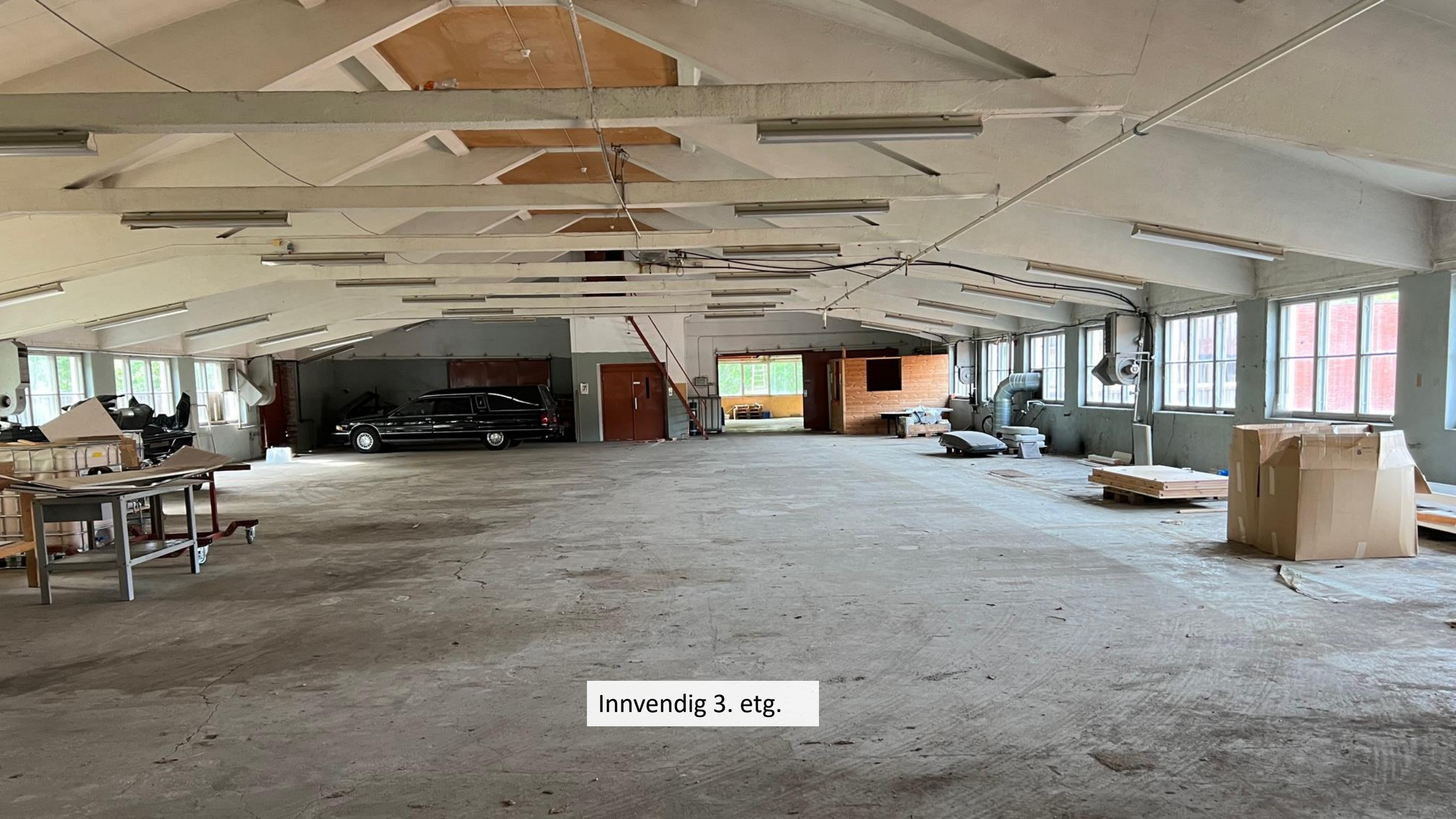
Innvendig 3. etg.