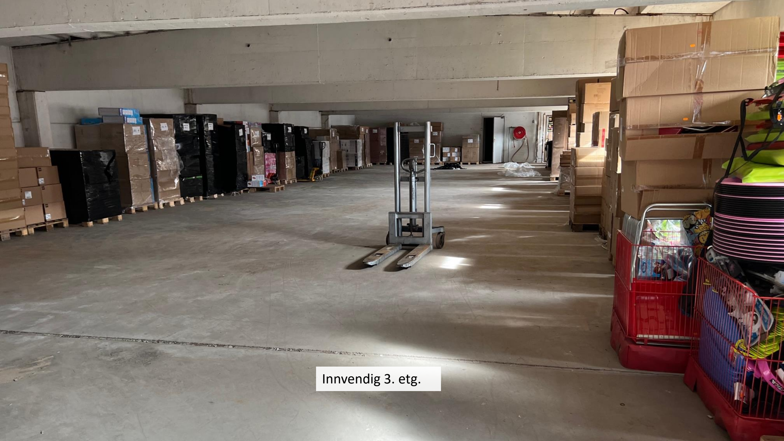
Innvendig 3. etg.