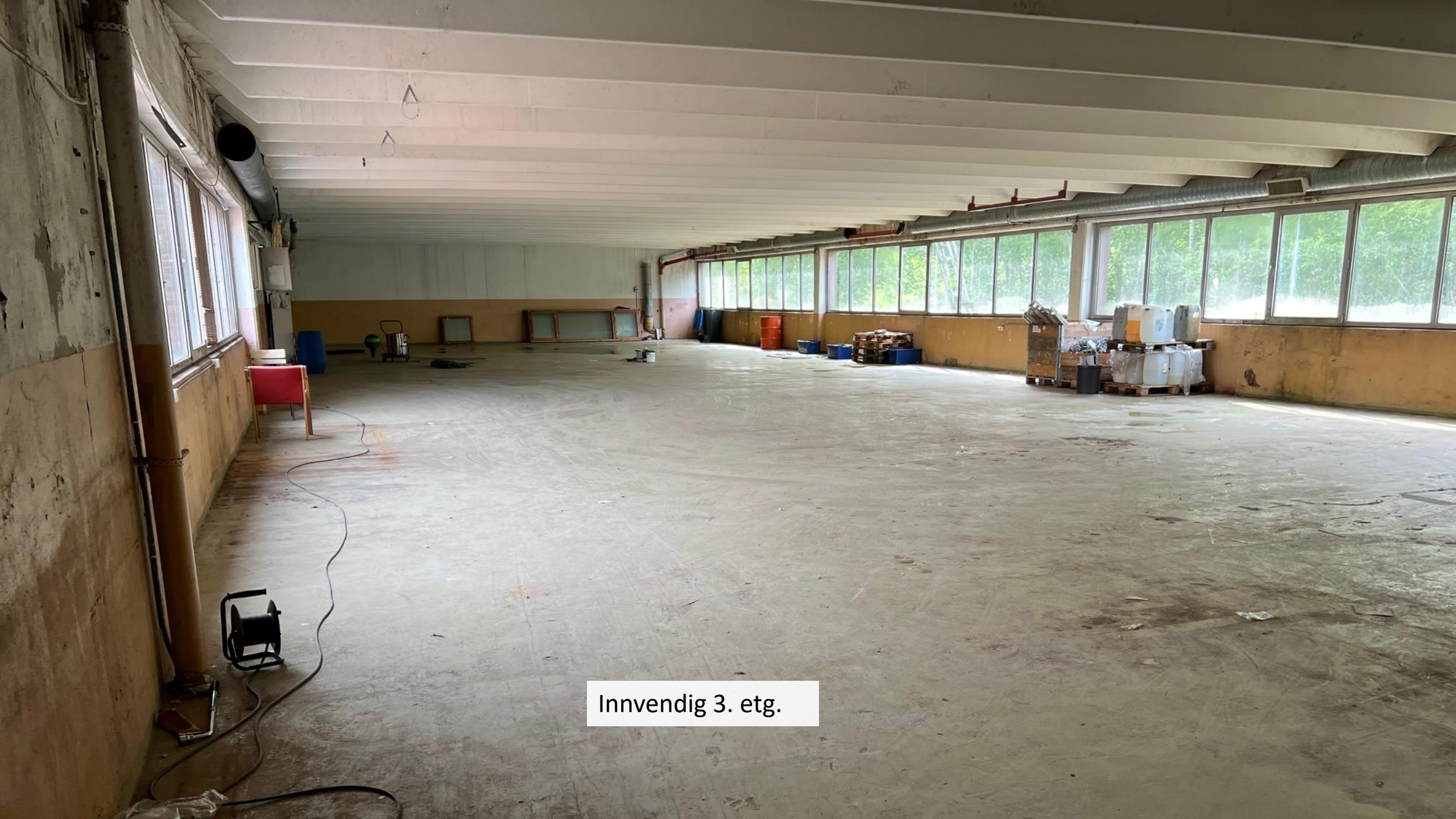
Innvendig 3. etg.