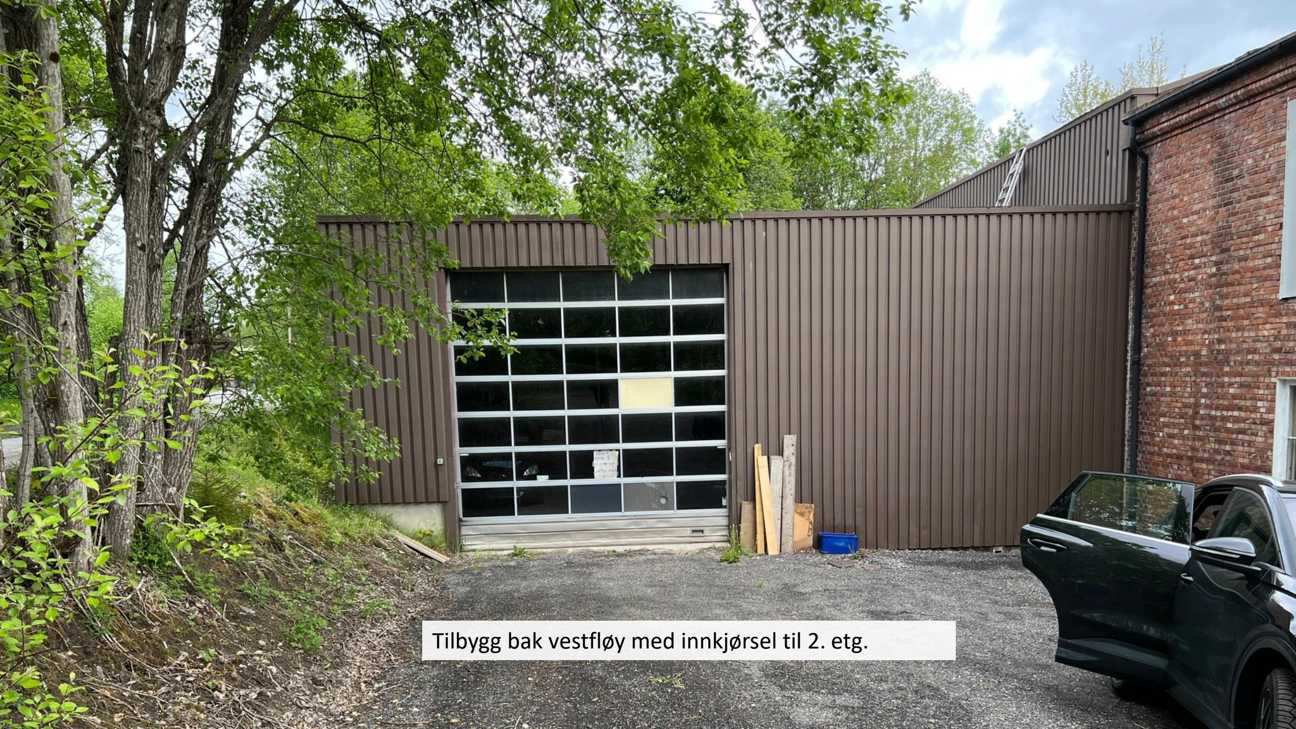
Tilbygg bak vestfløy med innkjørsel til 2. etg.