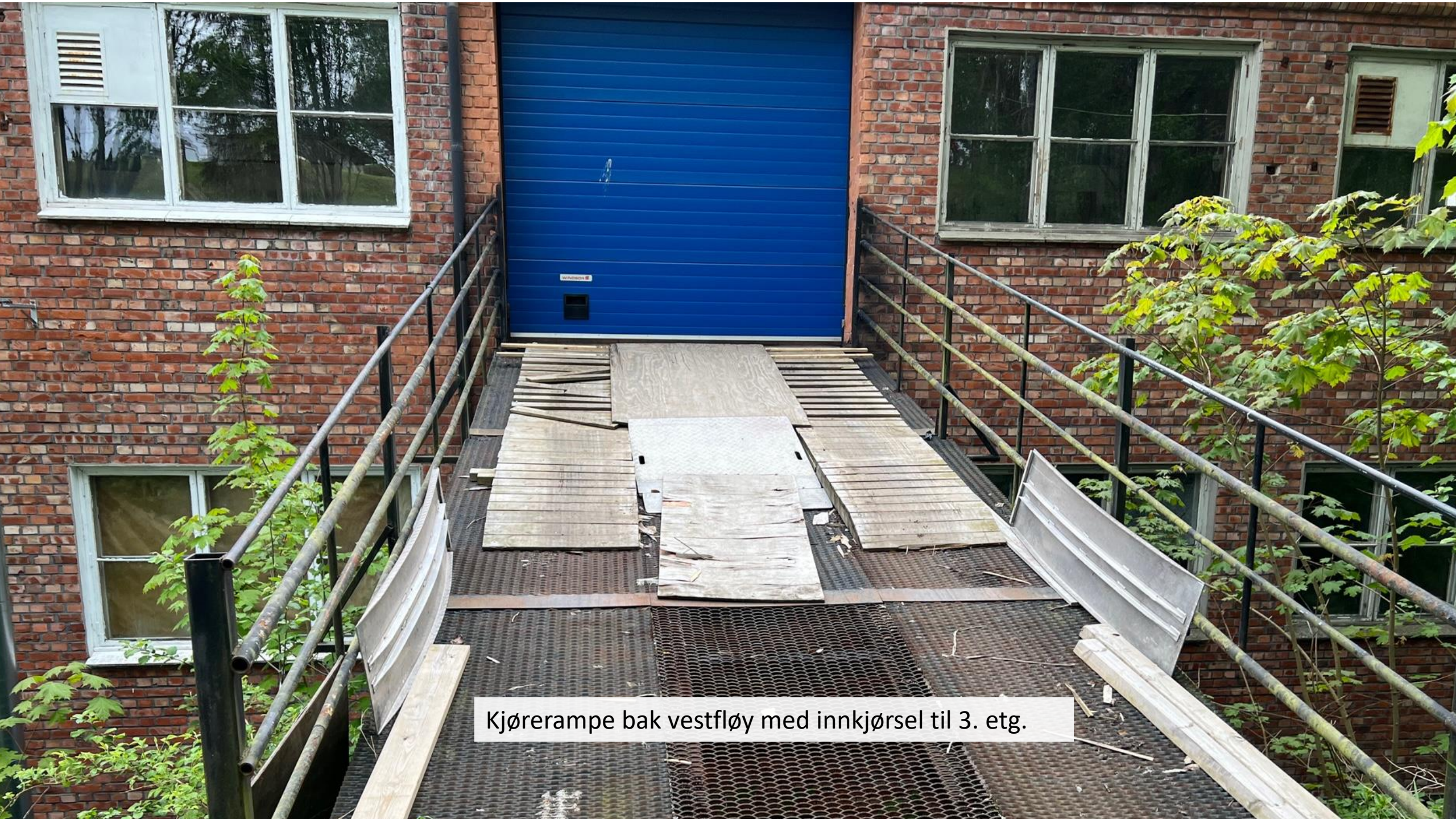
Kjørerampe bak vestfløy med innkjørsel til 3. etg.