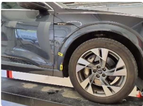
1.7 Øvrige feil Lakk. Oppskrapet hjulbuelist høyre foran