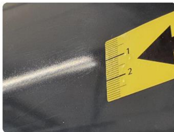
1.2 Øvrige feil Lakk. Tidligere omlakkert høyre bakdør. Ikke tilfredsstillende utført