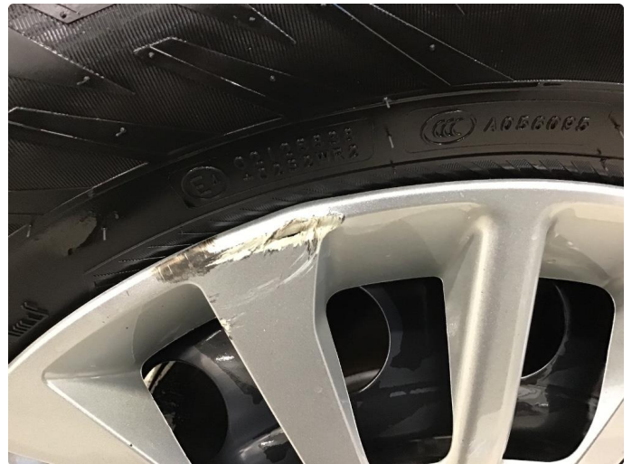
1.1 Hjulksel skadet