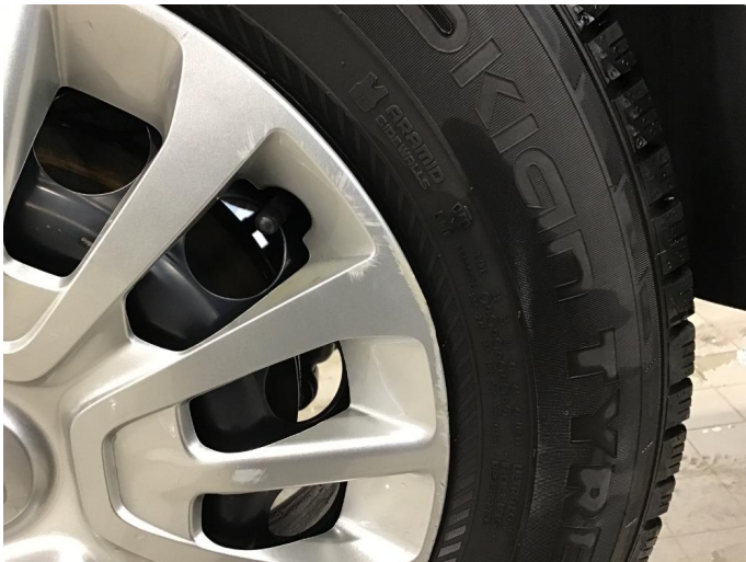
1.1 Hjulksel skadet