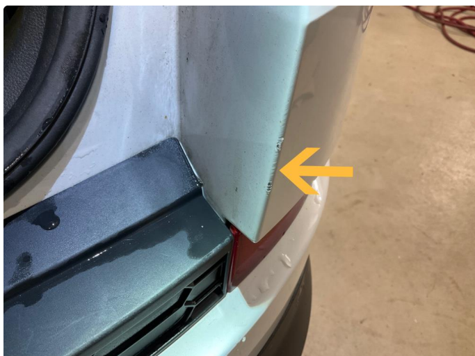
1.1 Skarpe kanter