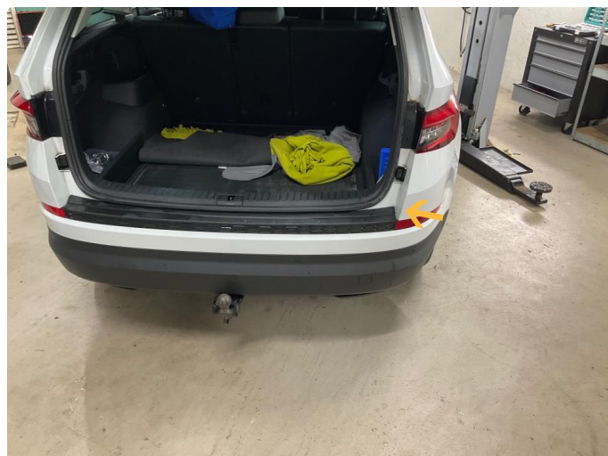
1.1 Skarpe kanter