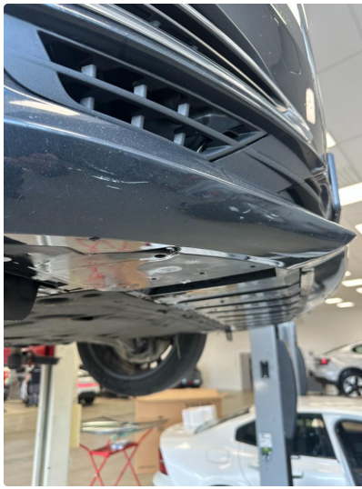
1.3 Noen riper i underkant av fenger foran. Normal slitasje