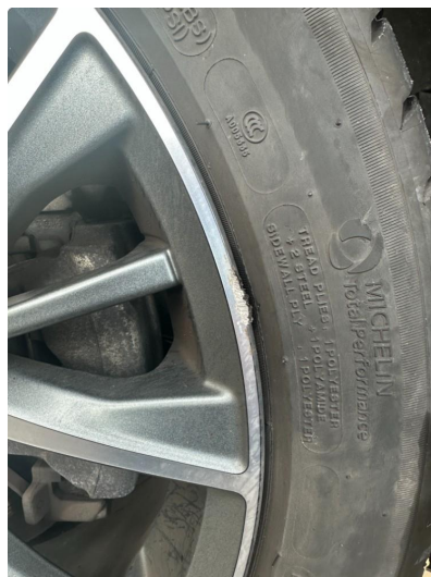
1.1 En sommerfelg litt kantkjørt