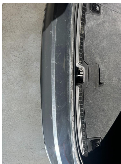
1.2 Noen riper i lastesone på fanger bak. Rubbes og poleres