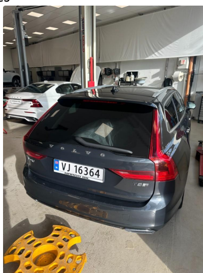
1.2 Noen riper i lastesone på fanger bak. Rubbes og poleres