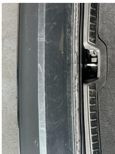
1.2 Noen riper i lastesone på fanger bak. Rubbes og poleres