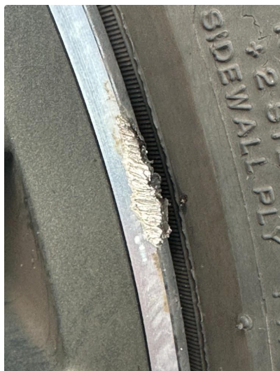
1.1 En sommerfelg litt kantkjørt