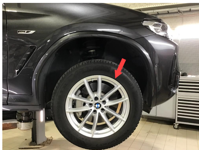
1.2 Noe bruksmerke felg h-fremme.