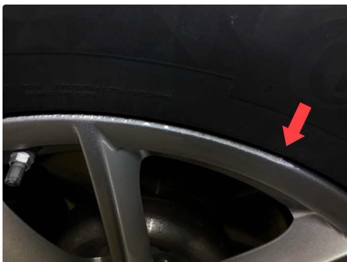
1.2 Noe bruksmerke felg h-fremme.