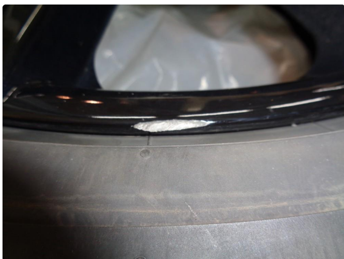
1.3 Kantkjørt sommerfelg - penslet