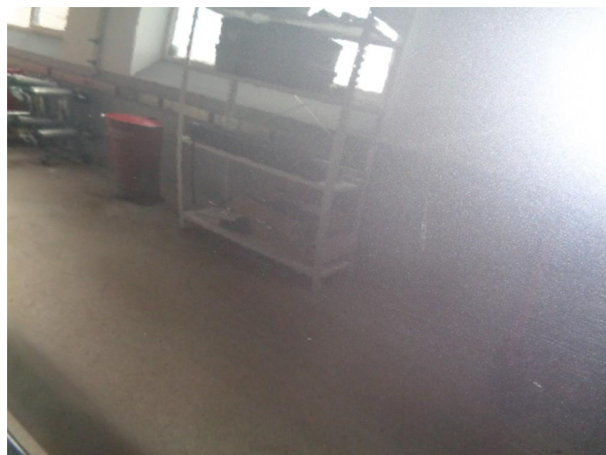
1.1 Generelt slitt lakk