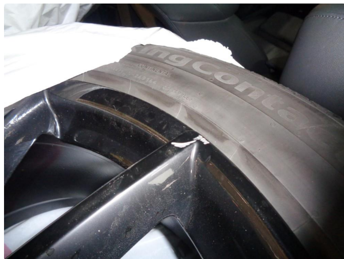
1.3 Kantkjørt sommerfelg - penslet