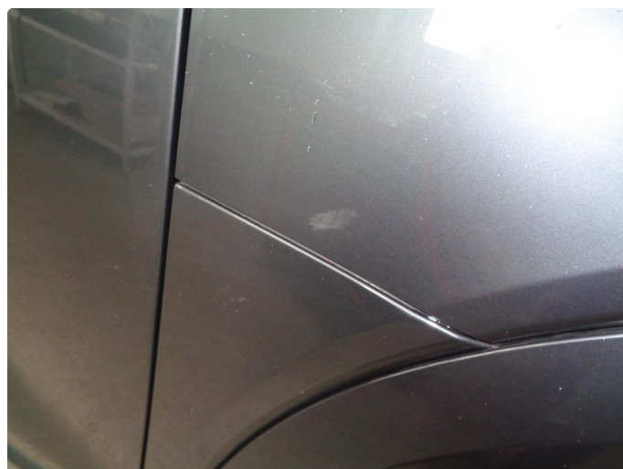
1.1 Generelt slitt lakk