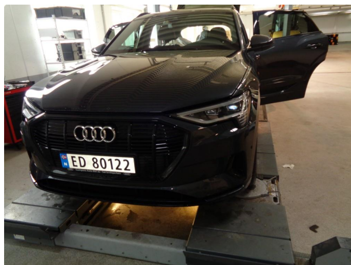
2.1 Neste service på 60.000 km / Mars 2024