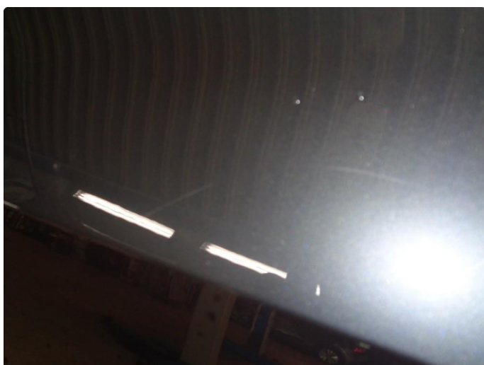
1.1 Generelt slitt lakk