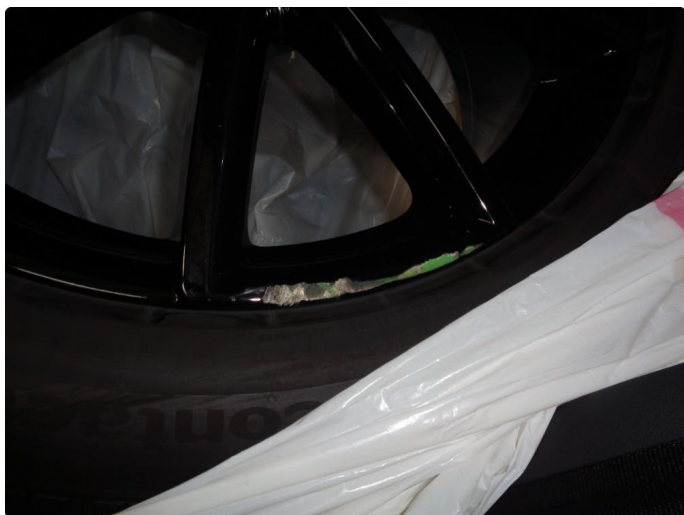
1.3 Kantkjørt sommerfelg - penslet