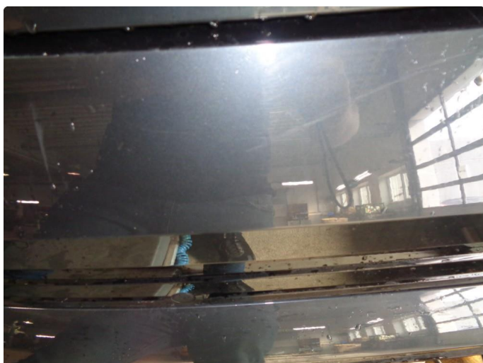
1.1 Generelt slitt lakk