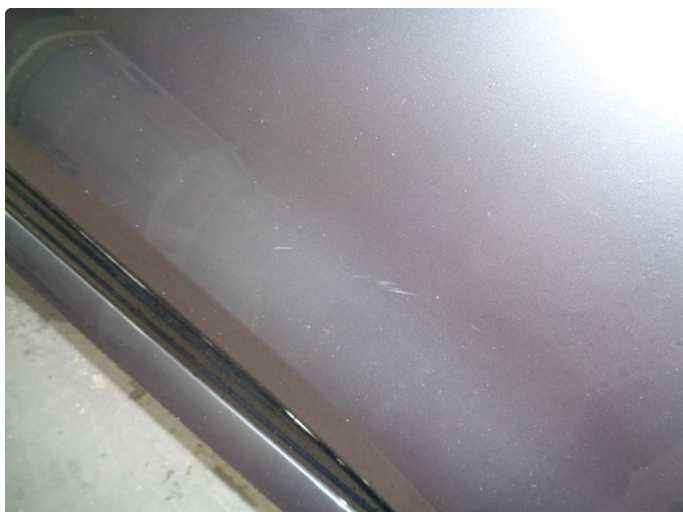
1.1 Generelt slitt lakk