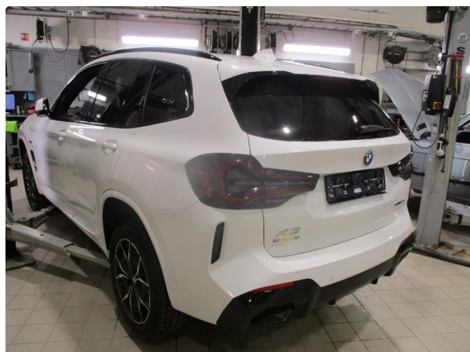
1.1 Oversiktsbilder av bil.