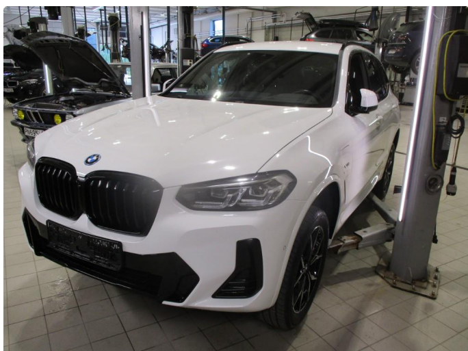
1.1 Oversiktsbilder av bil.