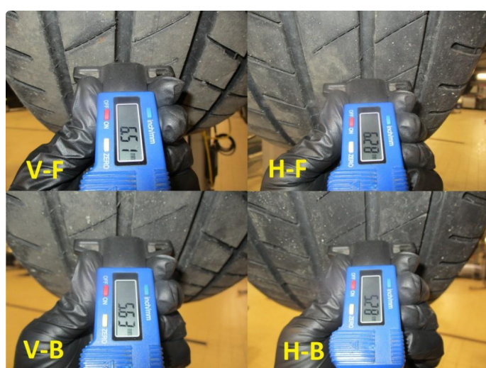
1.2 Mønsterdybde sommerdekk målt ved takst 28.06.23, 42.993km.