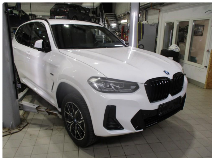
1.1 Oversiktsbilder av bil.