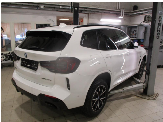
1.1 Oversiktsbilder av bil.