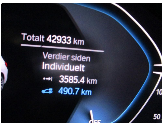
1.1 Oversiktsbilder av bil.