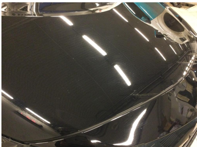
1.1 Generelt mye riper og småbulker