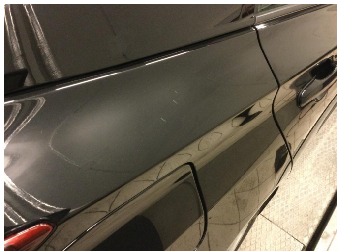
1.1 Generelt mye riper og småbulker