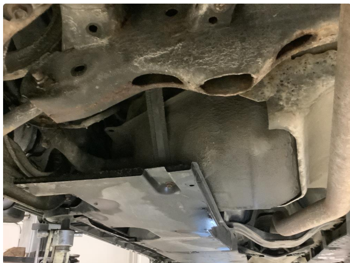
5.3 Byttet bærebruer bak.