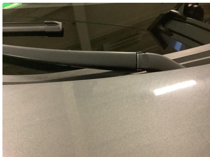
2.2 Noe steinsprut med rust