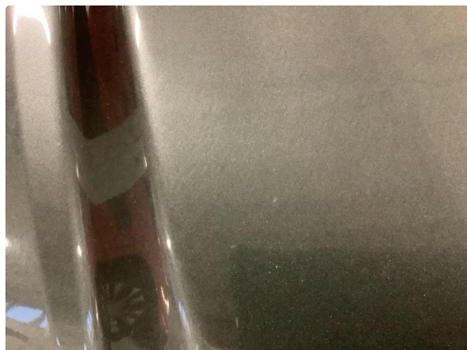
2.2 Noe steinsprut med rust