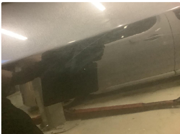
2.1 Rubbet og polert opp bil.