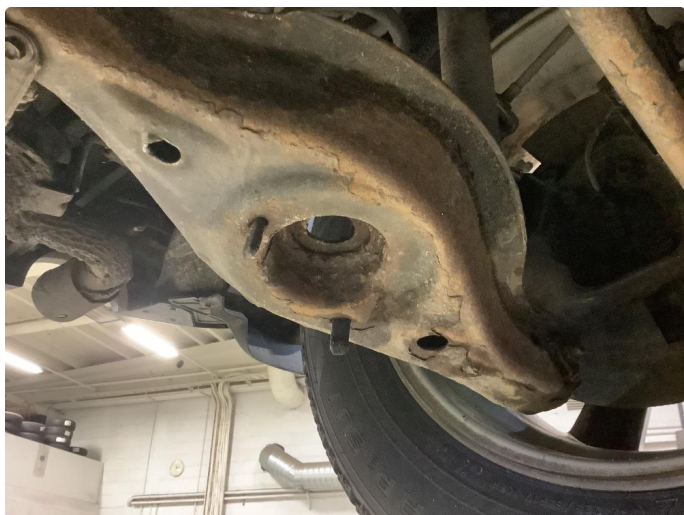
5.3 Byttet bærebruer bak.