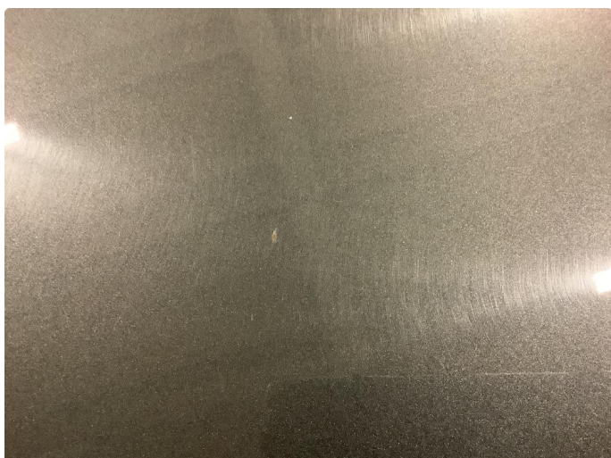
2.2 Noe steinsprut med rust