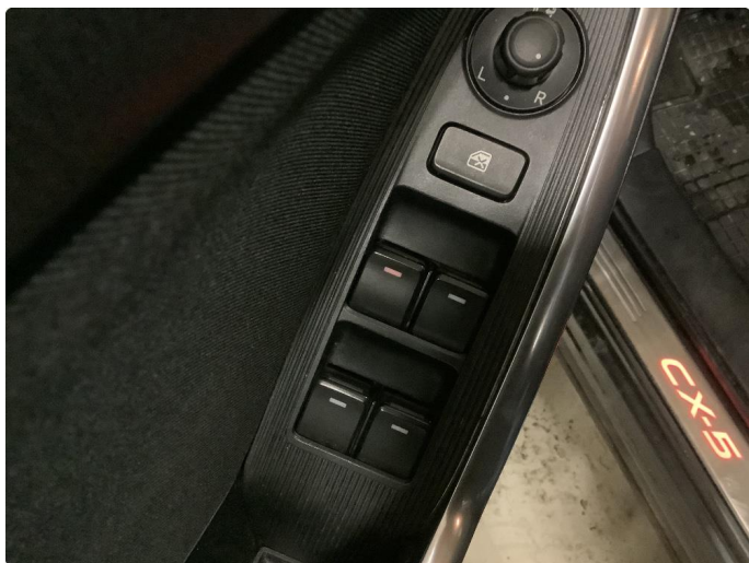
6.1 Bryterbelysning virker ikke