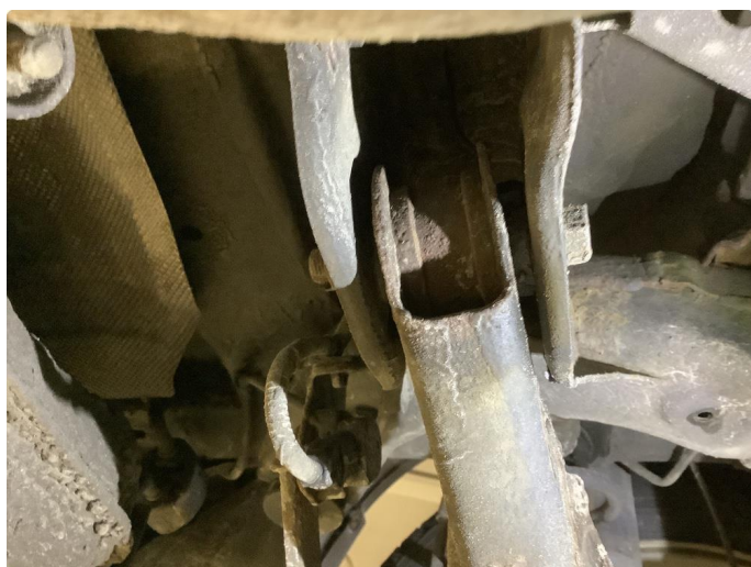
5.2 Byttet begge bærebruer bak.