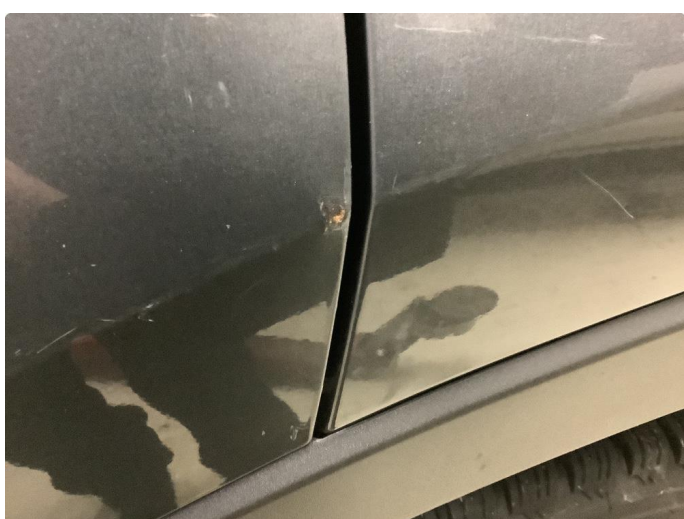
2.3 Bulk med lakkskade