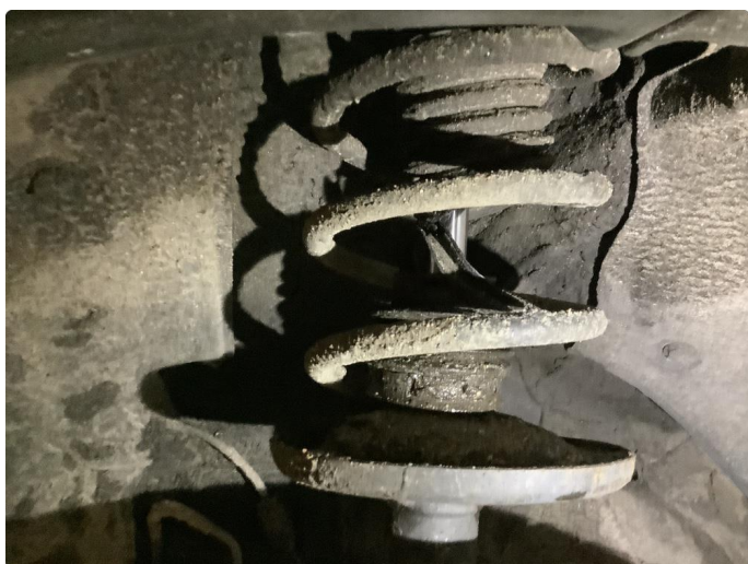
5.1 Støvmansjett defekt