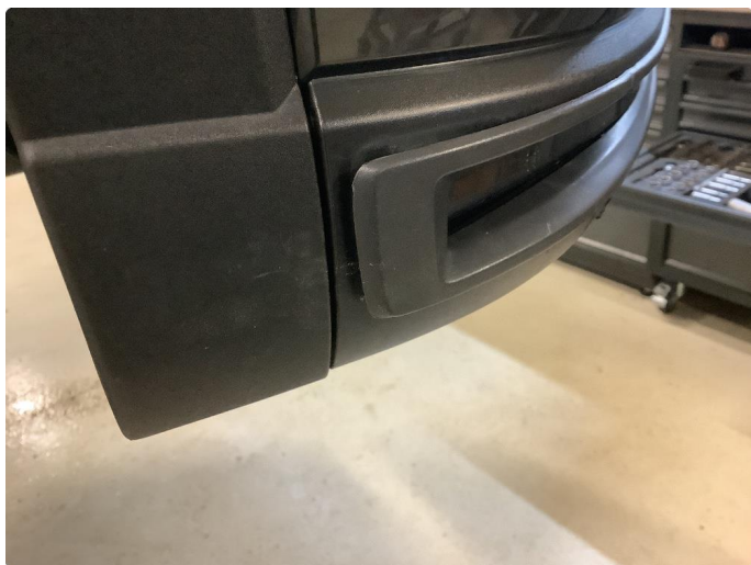
3.1 Festet lykt.