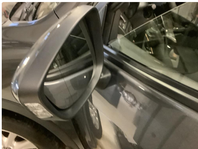
2.6 Byttet speil.