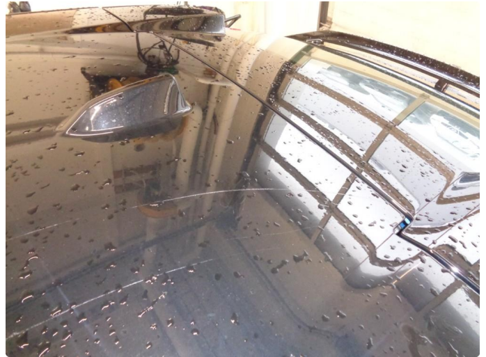
1.1 Øvrige feil