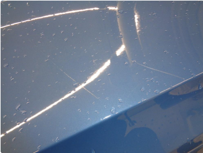
1.1 Øvrige feil