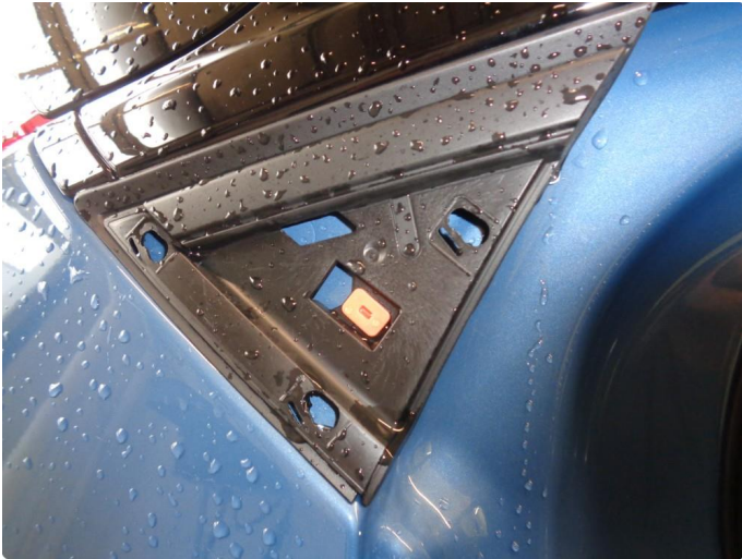
1.3 Deksler på tak/rails mangler