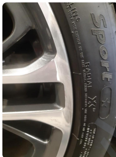
1.3 Berøringspunkter på 3/4 felger hvor tidligere slipt kanter. Bør behandles med ny lakk for å bli bra og varig.