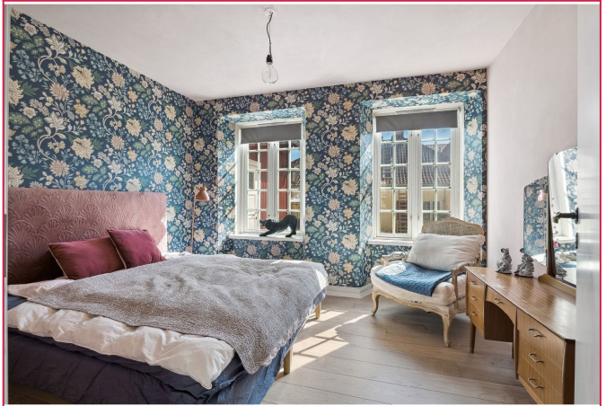
Leiligheten har 3 romslige soverom. Alle soverommene har dobbeltseng