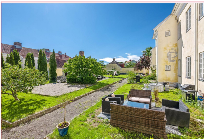
Felles uteområde i midten! Sandkasser, sitteplasser og plass til å ha sykkel