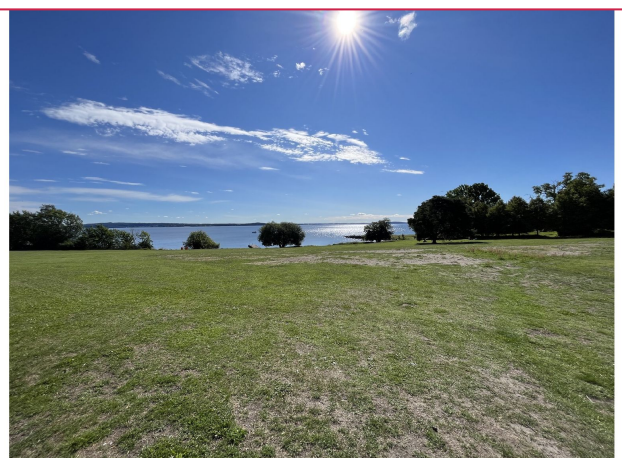
Få meter fra leiligheten finner du Vollane badestrand!