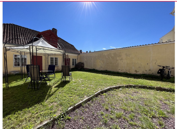
Leiligheten har en egen uteplass på baksiden som kan disponeres av leietaker. På høyre side