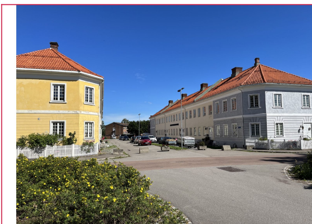
Veletablert og rolig boligområde på Karljohansvern!