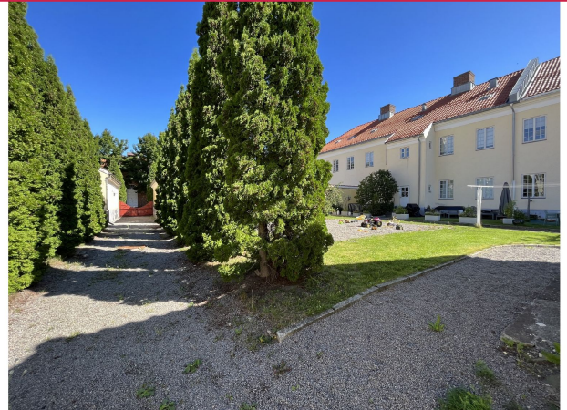
Koselig uteområde, spesielt på sommerhalvåret!