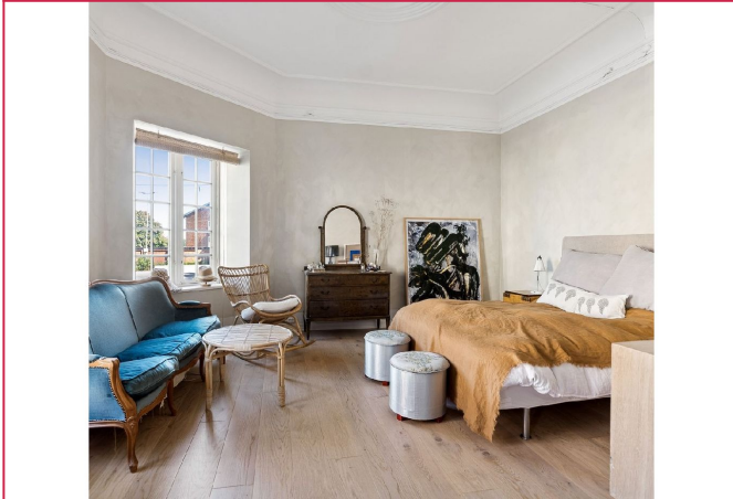
Lyst og fint hovedsoverom