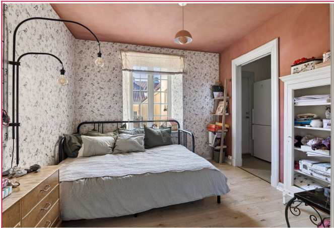
Dette soverommet har tilknytning til vaskerom og utgang til felles uteområde