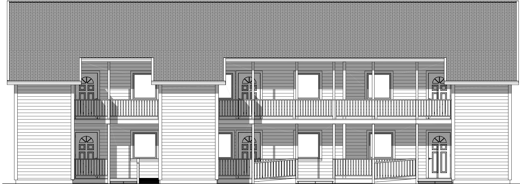
Fasade mot vest