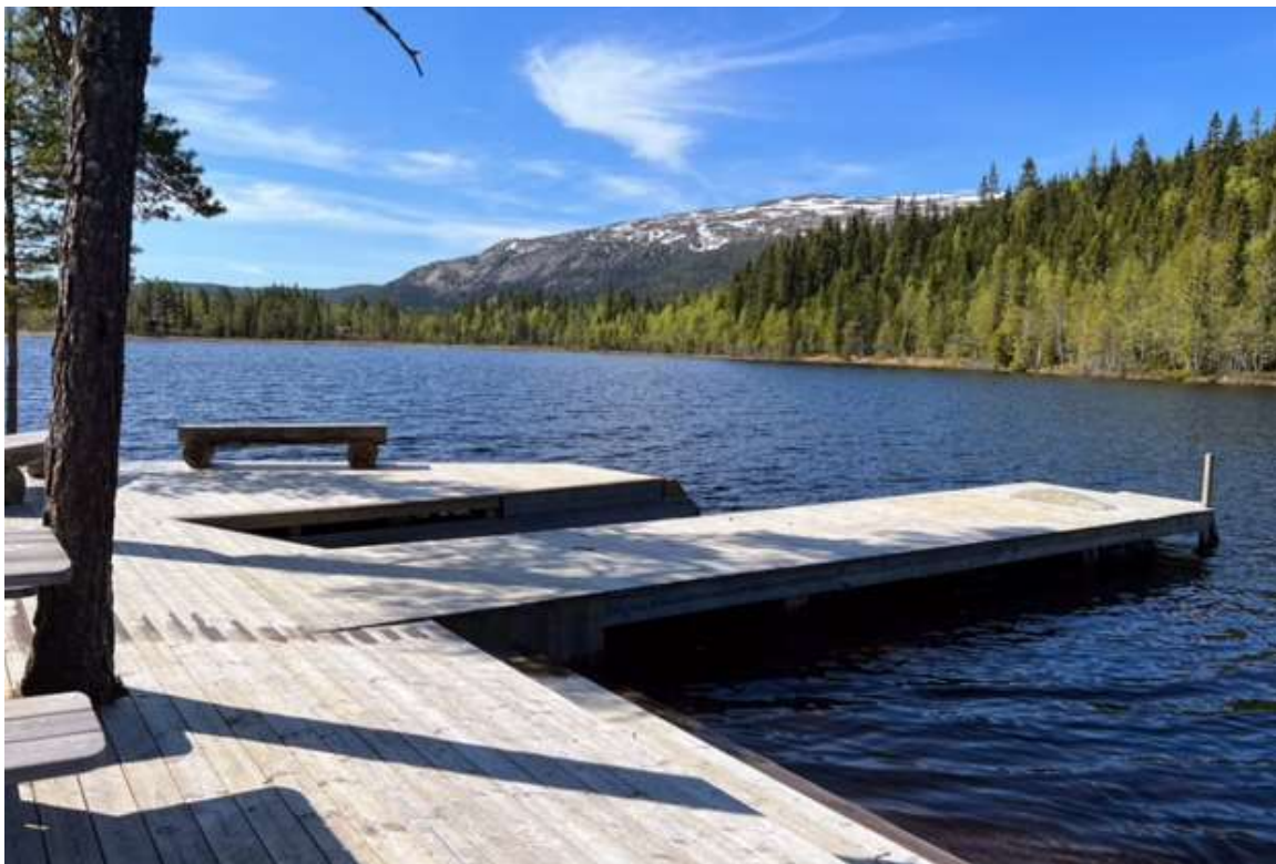
Noen få hundre meter fra tomten ligger dette flotte badeanlegget – her er det gapahuk og grillplass også