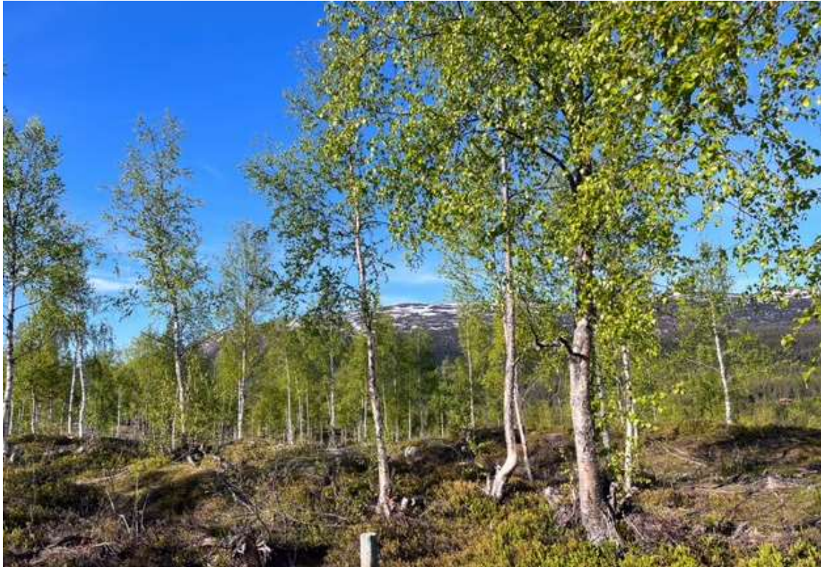
Det blir panoramautsikt mot Vikerfjell ved å hogge noen bjørketrær