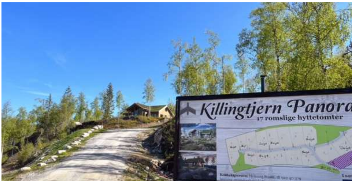
Bildet viser adkomstveg opp i Killingtjern 2 hyttefelt.