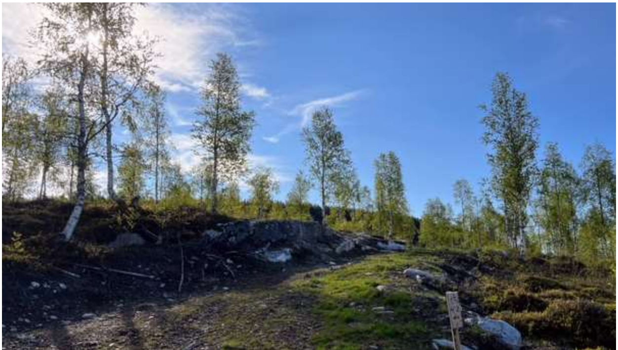
Planlagt adkomst opp til hytta fra eiendomsgrense ved hovedvegen