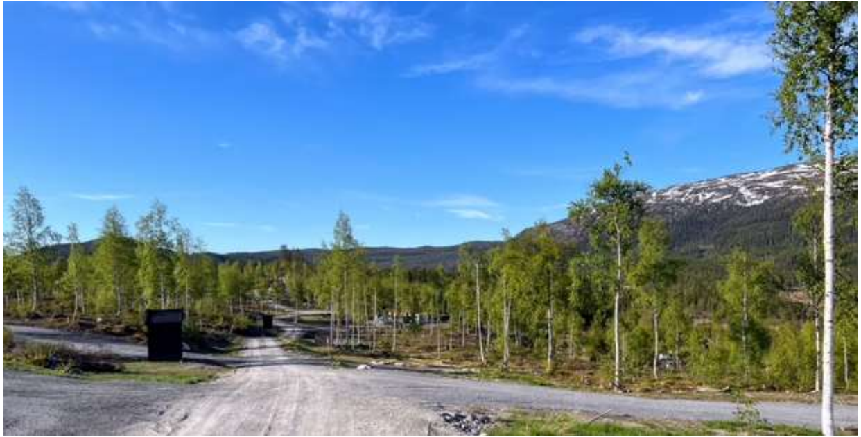
Tomt 136 ligger til venstre midt på bildet