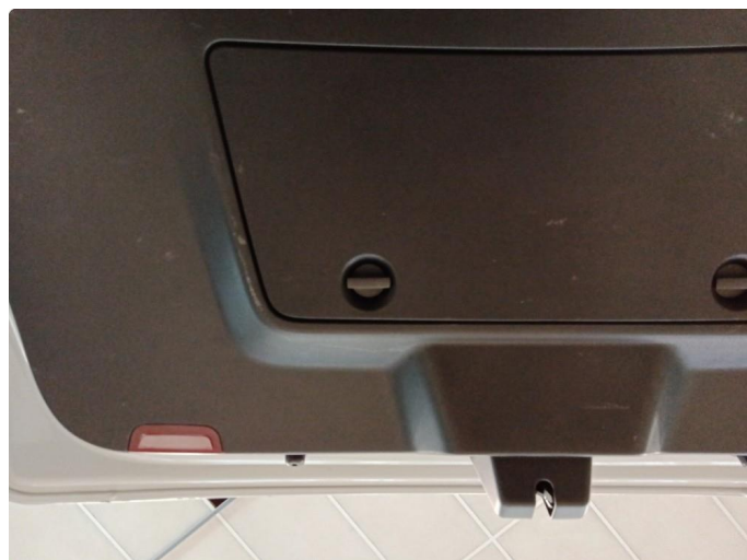
2.1 Bruksmerker på innvendig deksel bakluke