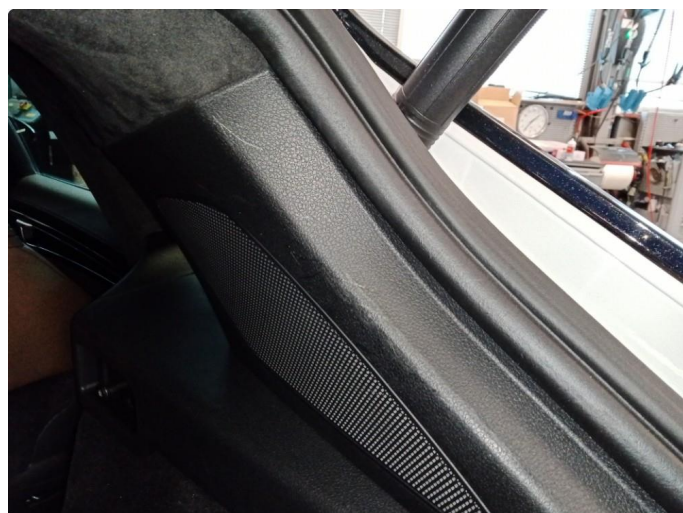
2.3 Bruksmerker i bagasjerom