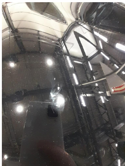
1.2 Normale bruksmerke