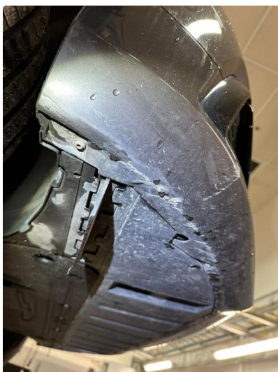
1.3 Noe skrubbskader underkant