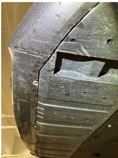
1.3 Noe skrubbskader underkant