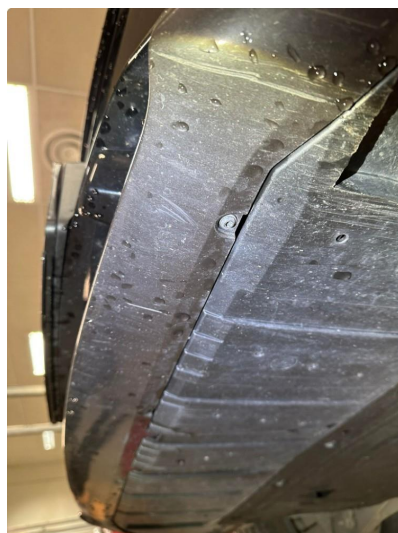
1.3 Noe skrubbskader underkant