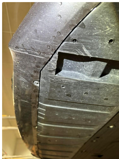
1.3 Noe skrubbskader underkant