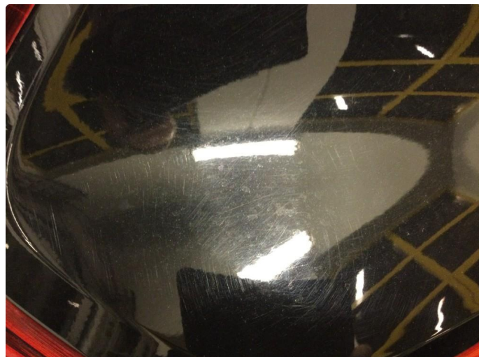
1.1 Generelt mye riper