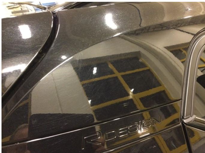
1.1 Generelt mye riper