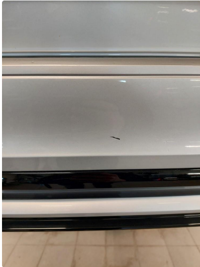
1.1 Ripe(r) ned til grunning