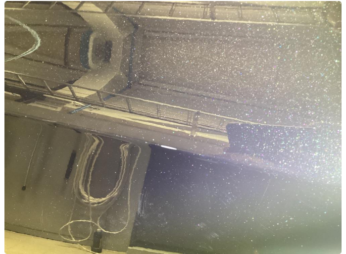
1.2 Ripe(r) normalt ihht km og alder