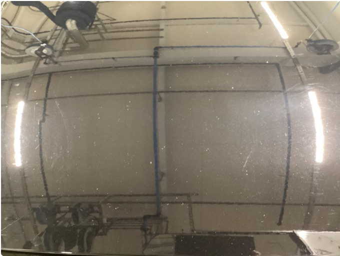
1.1 Steinsprut, normal slitasje