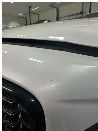
1.2 Noe små steinsprut frontfanger