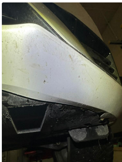
1.3 Noe skrubbsår underkant frontfanger