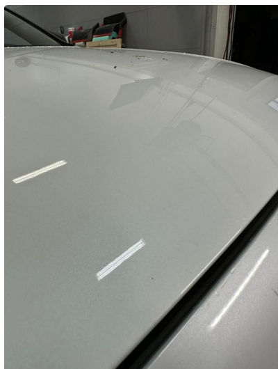
1.1 Noen små steinsprut panser