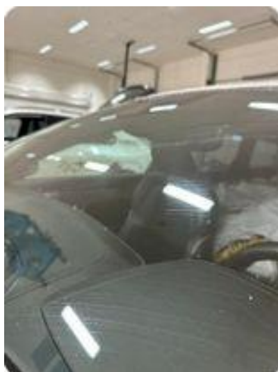
1.4 Noe steinsprut frontrute