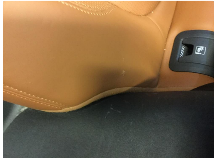
2.1 Skade på setetrekk