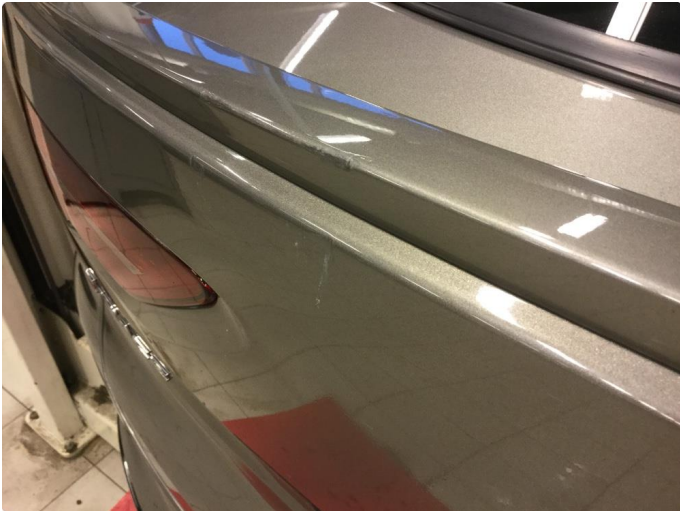
1.1 Bulk med lakkskade