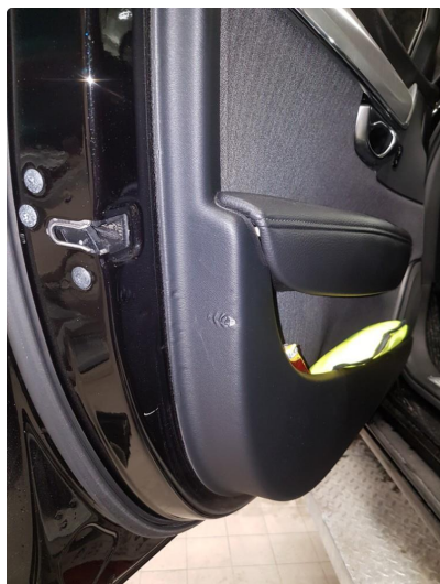
3.1 Skadet/merker etter utstyr, normal slitasje ihht alder og km