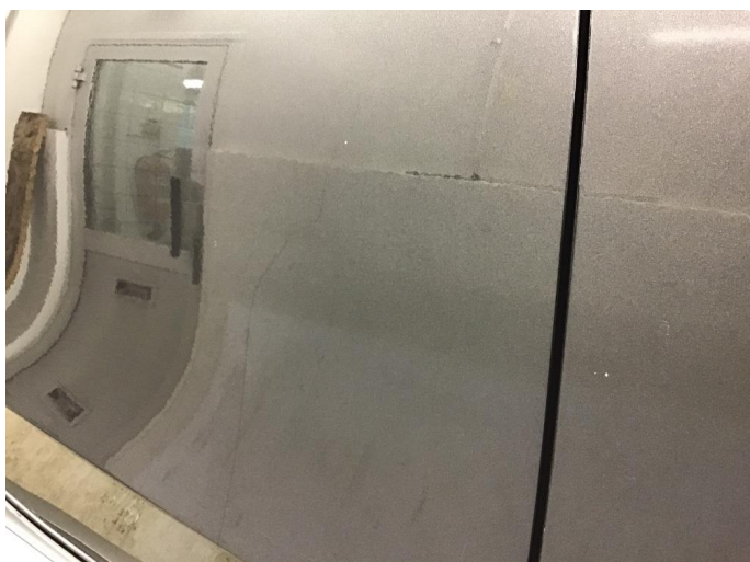
1.1 Noe steinsprut rundt om