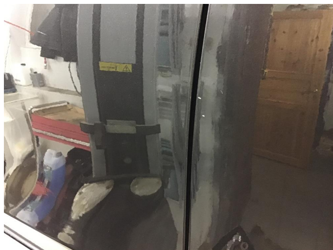
1.1 Noe steinsprut rundt om