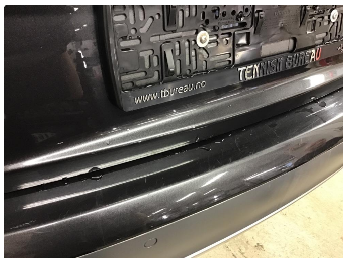
1.2 Noen ripe(r)