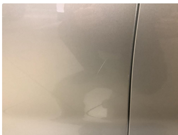
1.3 Riper Fikset