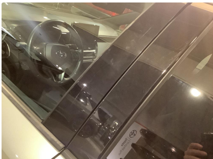
1.1 Løse/skadede lister Fikset