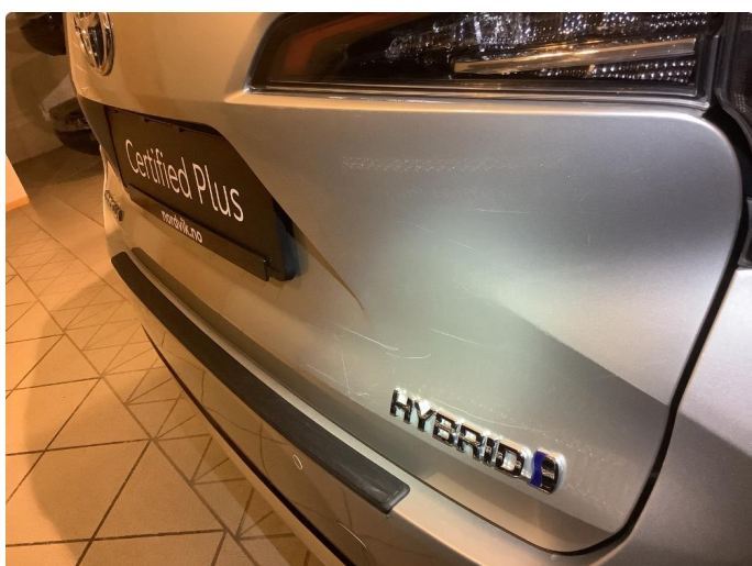
1.3 Riper Fikset