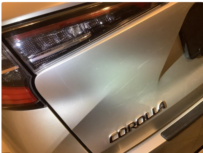
1.3 Riper Fikset