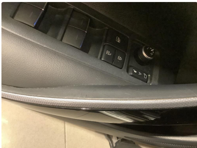
3.1 Slitt/ripe(r) Fikset