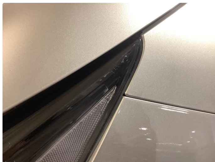
2.1 Riper i glass Fikset