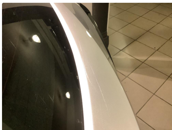
1.3 Riper Fikset