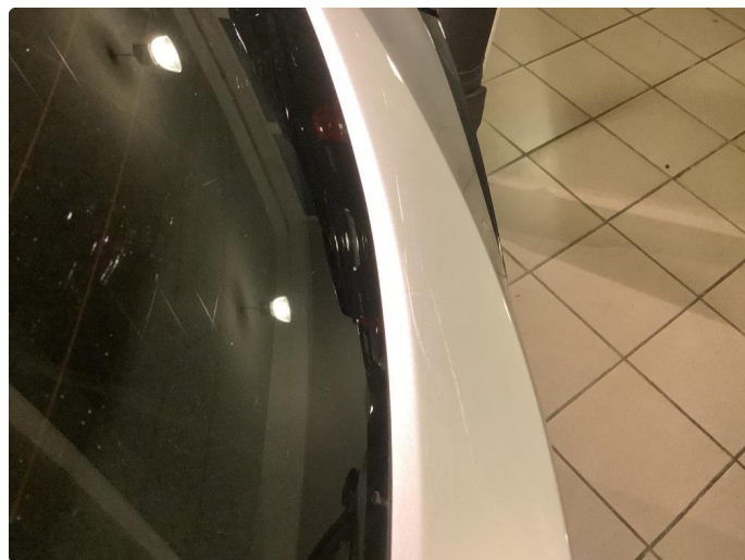
1.3 Riper Fikset