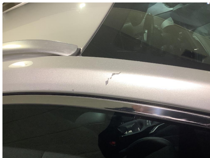
1.2 Ripe ned til grunning Fikset