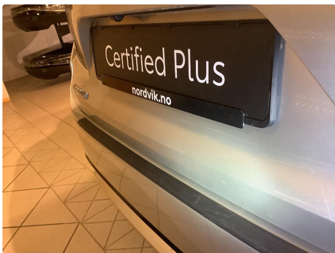
1.3 Riper Fikset