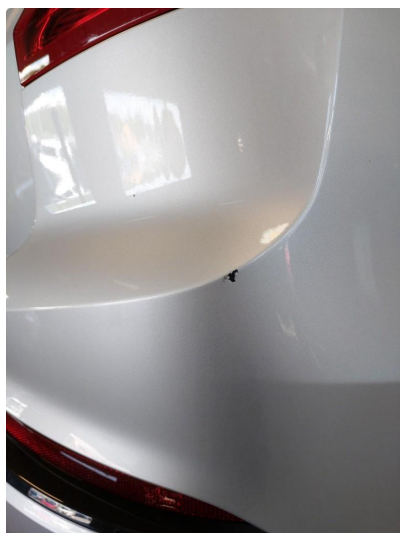
1.3 Ripe(r) ned til grunning