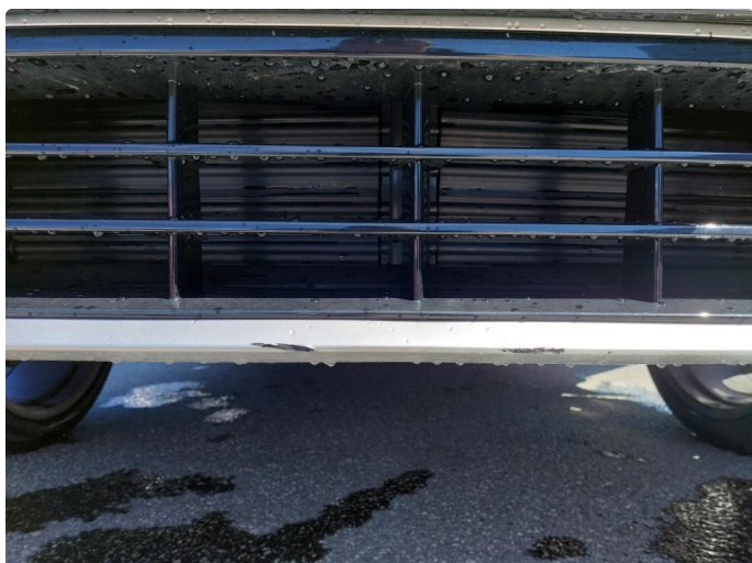
1.2 Ripe(r) ned til grunning