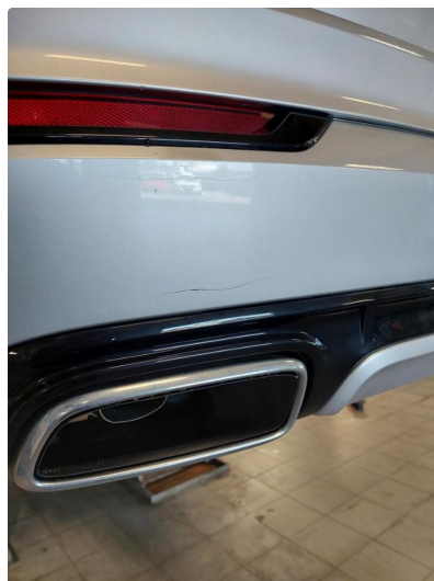
1.3 Ripe(r) ned til grunning