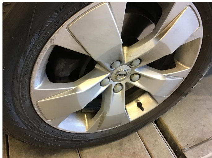
1.3 Kantkjørt felg