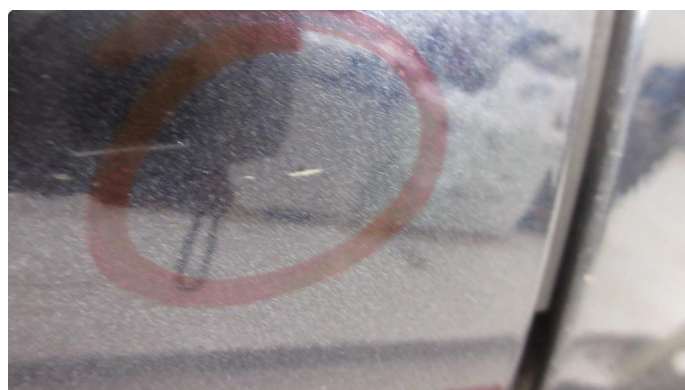
1.1 Noe steinsprut