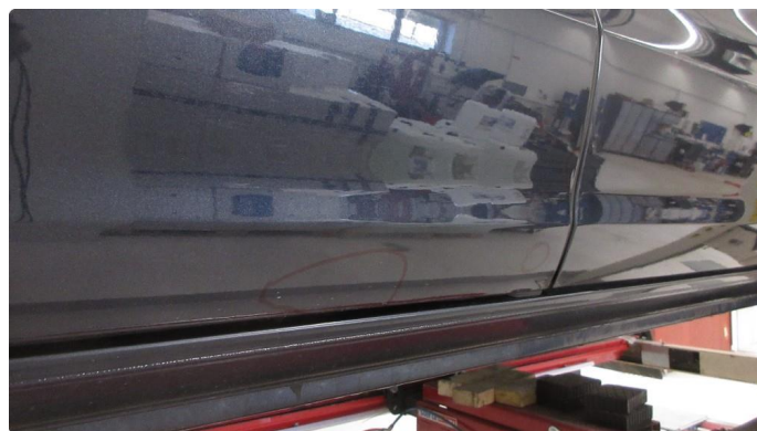
1.1 Noe steinsprut