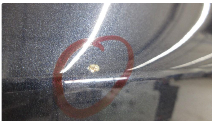
1.1 Noe steinsprut